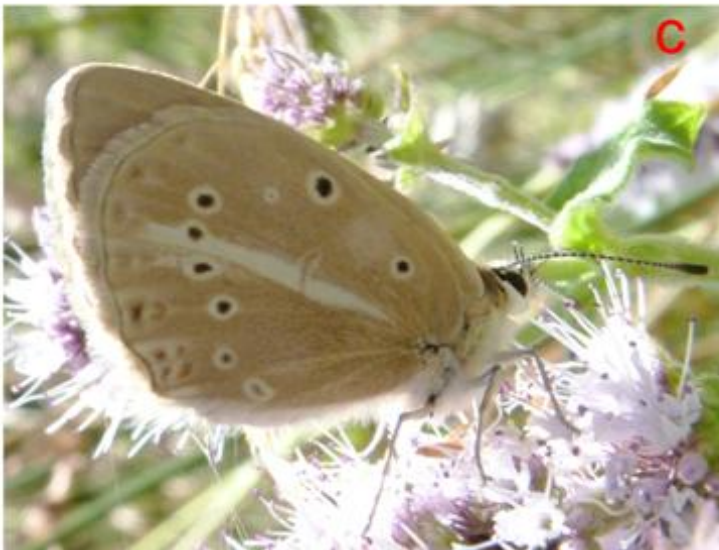
Fig. 2.- Agrodiaetus violetae Gómez-Bustillo, Expósito & Martínez, 1979, en tres de las nuevas localidades: