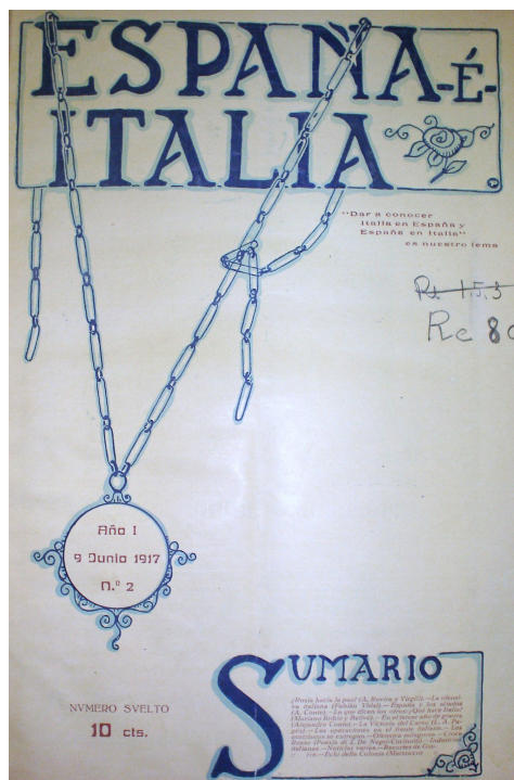
Portada de la revista España e Italia (1917)