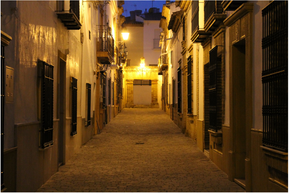
Actual calle Navas de Tolosa en Arjonilla, conocida comúnmente como "Calle Convento" por encontrarse allí ubicado el Convento de Santa Rosa de Viterbo. Al fondo se conserva la portada que daba acceso a las huertas de los frailes