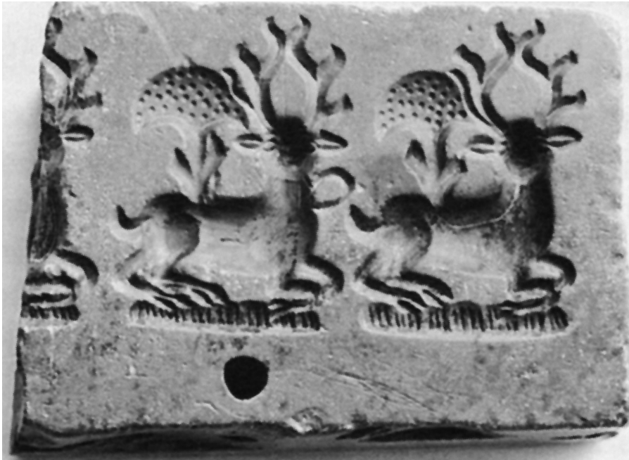
Fig. 7 Matriz del ciervo, St Peter Hungate Museum de Norwich (76.94-429)