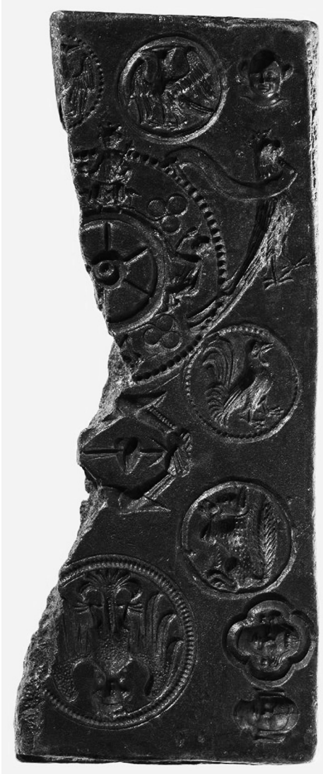
Fig. 9 Matriz múltiple, anverso, British Museum