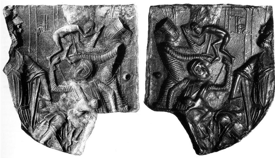
Fig. 6 Matriz y positivo de la Matanza de los Inocentes. St Peter Hungate Museum, Norwich (76.94-429)