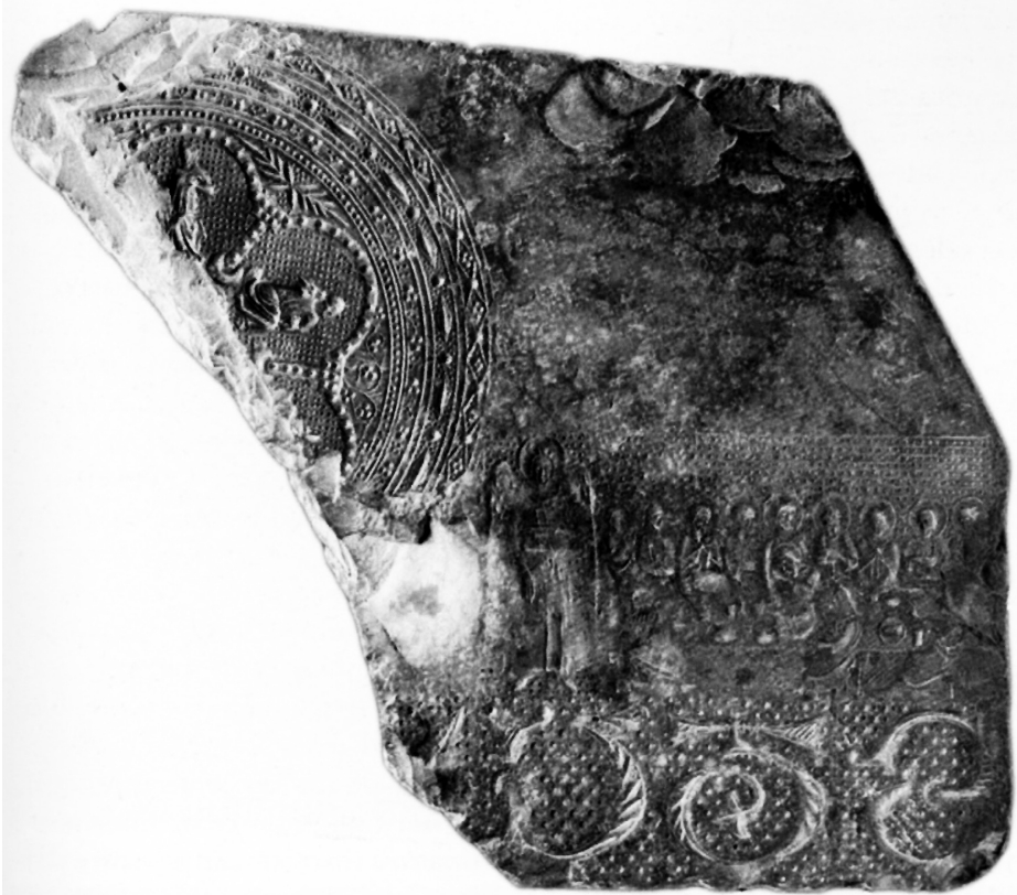
Fig. 8 Matriz múltiple, anverso, Museo Civico Medievale de Bolonia (inv. N. 1624)