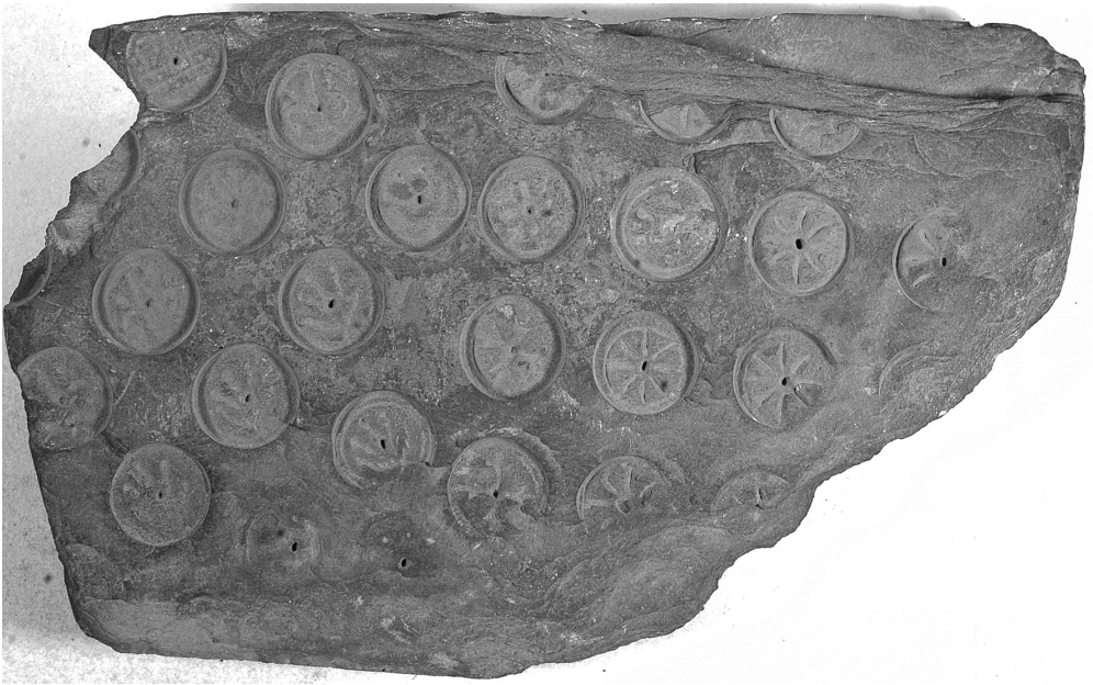
Fig. 4 Arxiu Capítular de Mallorca. Matriz múltiple en pizarra