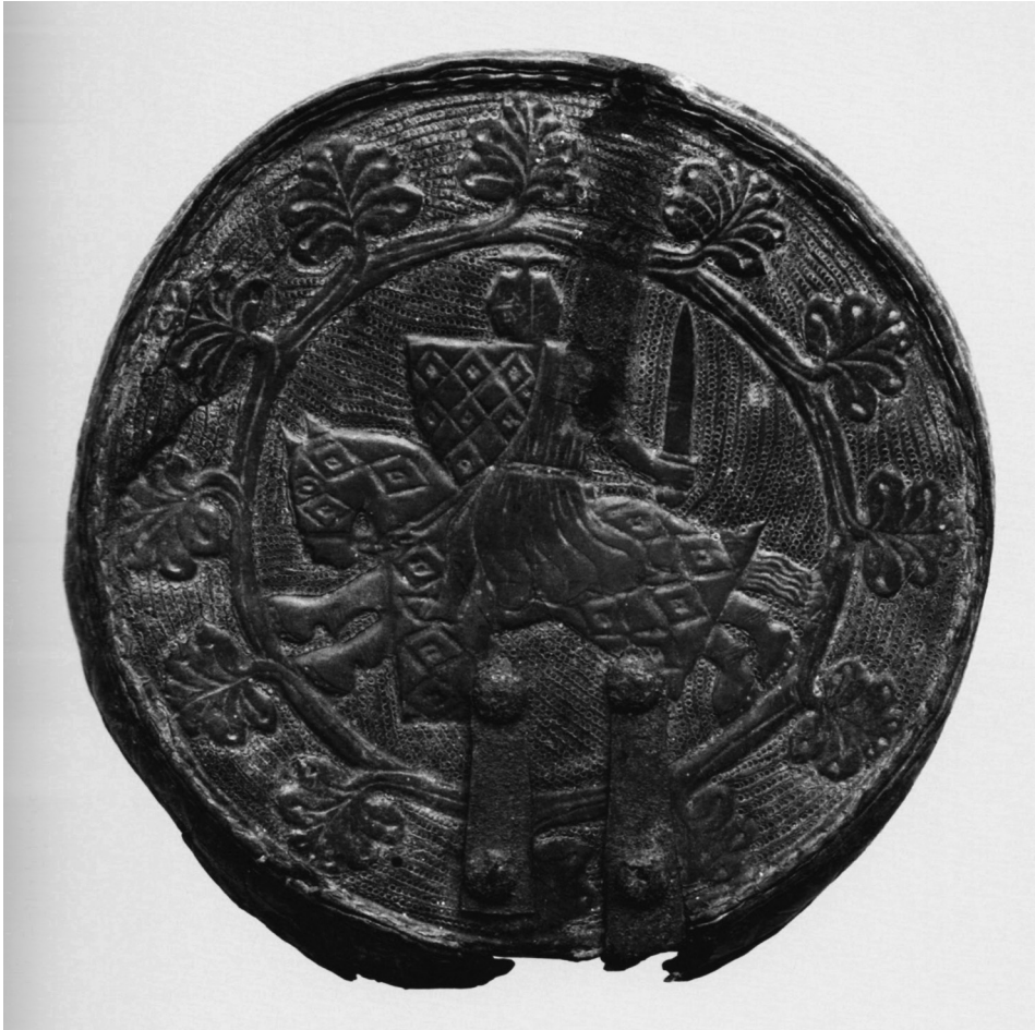
Fig. 10 Tapa de estuche de cuero de Peña de Azagra, Museo de Navarra (inv. 3547)