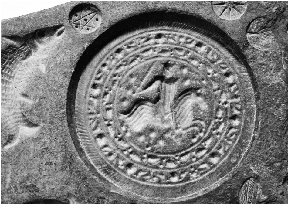
Fig. 2 Seu de Mallorca. Matriz múltiple en pizarra, anverso. Detalle del caballero