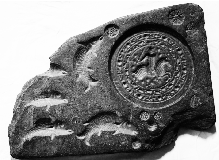
Fig. 1 Seu de Mallorca. Matriz múltiple en pizarra, anverso

¿Qué uso pudieron tener los metales repujados en las matrices de las pizarras mallorquinas? Lo desconocemos. Podríamos suponer que el carácter simbólico cristiano en los peces los haría adecuados como insignias en algún tipo de celebración; asimismo, el uso como botones o apliques de los círculos menores y el indudable carácter decorativo de la figura del caballero. No perdamos de vista que moldes de estas características también sirvieron para el repujado de pieles con motivos iconográficos idénticos y dimensiones parejas, como la tapa de estuche de cuero, procedente de Peña de Azagra y hoy conservada en el Museo de Navarra (inv. 3547). Aquí, hallamos a un caballero en idéntica postura a la representación de la pizarra de Mallorca (fig. 10) y rodeado de un disco decorativo, en este caso de tipo vegetal, imagen para la que también se ha destacado el ascendiente sigilográfico como modelo icónico y, sobre todo, el hecho de tratarse de un elemento de producción seriada, que contaba con moldes y matrices para su elaboración. 17 Parece claro, por tanto, que las pizarras de la catedral de Mallorca fueron matrices para el repujado, labrado o grabado de metales blandos, claramente emparentadas con otras piezas semejantes de matriz múltiple y bifaces, como la del Museo Civico Medievale de Bolonia o la del British Museum.