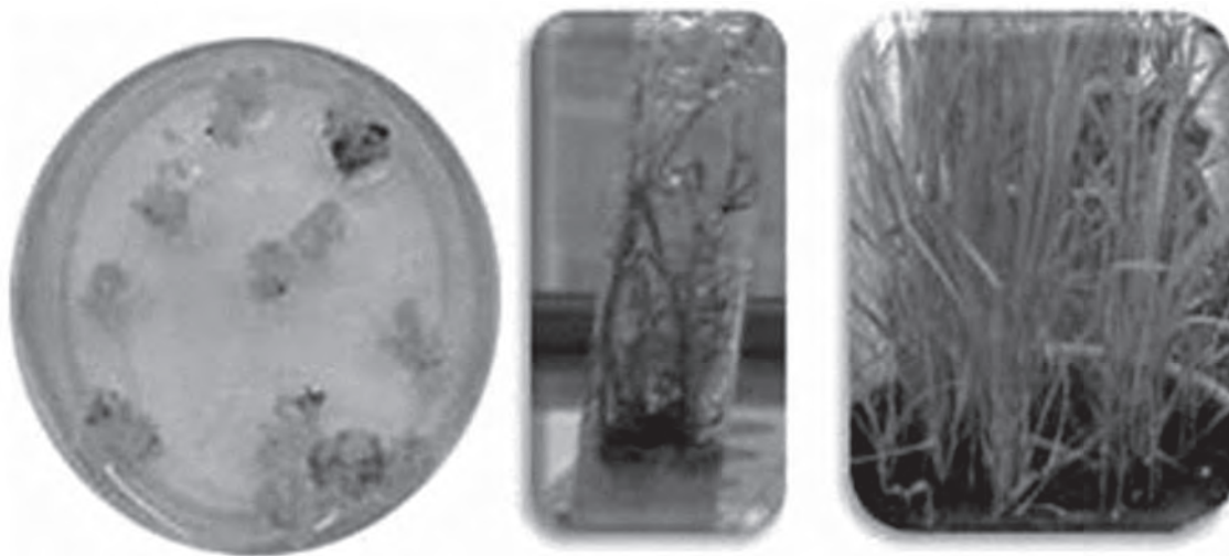
Figura 2. A-Callos formados, B-plantas verdes regeneradas in vitro y C- plantas en macetas, provenientes del cruce Amistad'82/ IR 759-54-2-2.