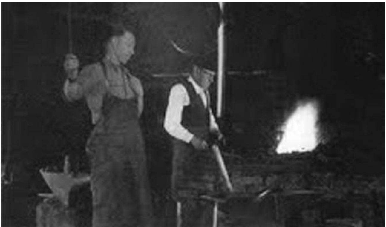
FRAGUA DE CASA EL FERRERU DE ANDAYÓN, 1944.