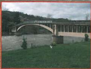
El puente de Valduno