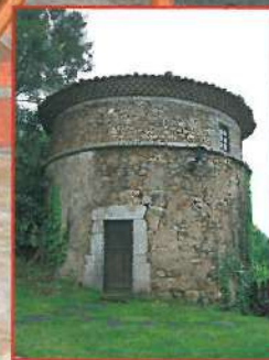
Palomares del concejo de Les Regueres