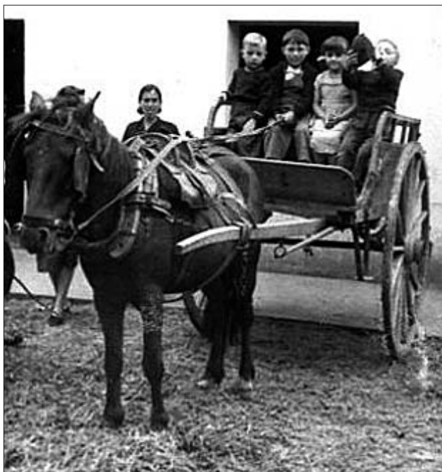
LAS ALBARDAS ERAN MUY NECESARIAS YA QUE LOS BURROS O CABALLOS ERAN EL TRANSPORTE HABITUAL EN LOS PUEBLOS.