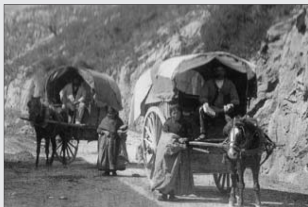
LOS CÓMICOS VENÍAN EN CARROMATOS COMO ÉSTOS. FOTO MIGUEL ROJO BORBOLLA. 1912 DEL LIBRO FOTOGRAFÍAS DE LA VIDA CAMPESINA , MUSEO DEL PUEBLO DE ASTURIAS, 2007.

En Casa Fernando de Mariñes recuerdan cómo venían los cómicos por el verano en uno o dos carromatos y, en un santiamén, organizaban una función al aire libre, al anochecer, en medio de la carretera.