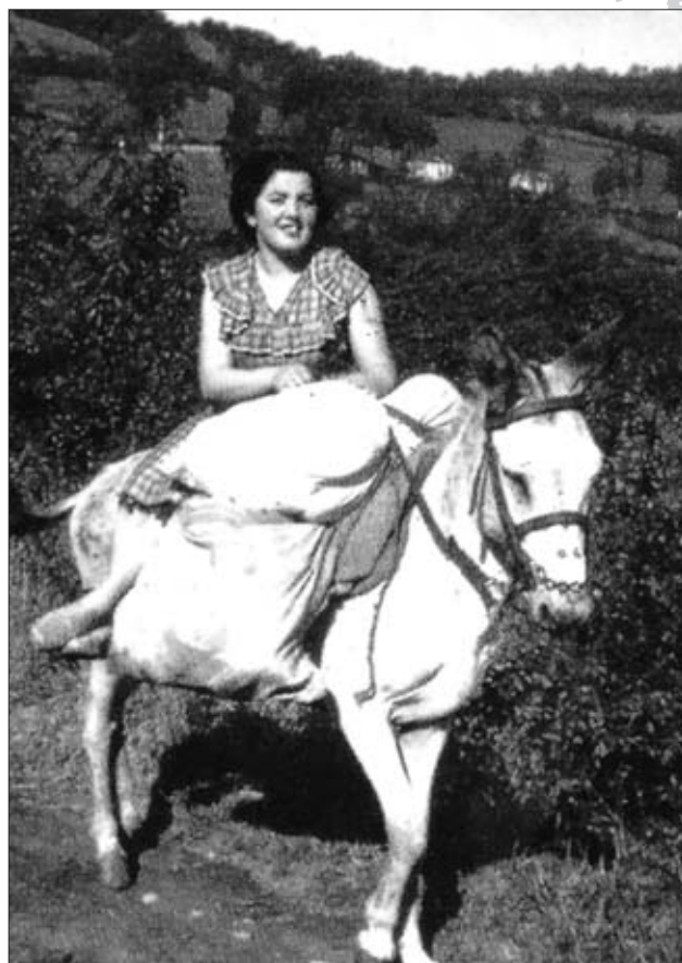
LA NENA TRAYENDO EL PAN DESDE ESCAMPLERO A PREMOÑO, 1953.