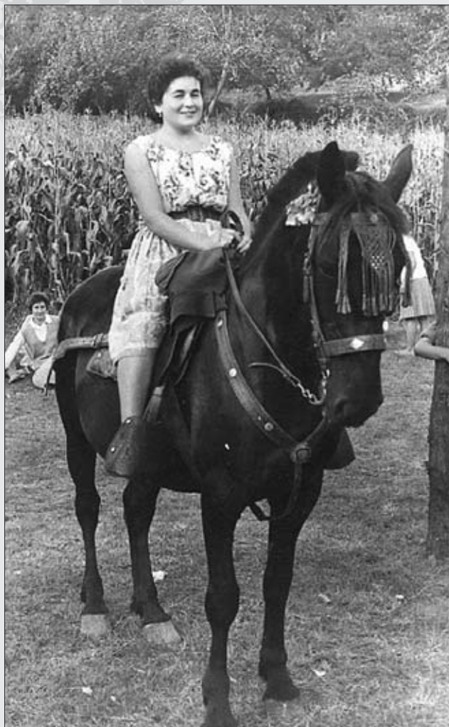
28 DE AGOSTO DE 1961 EN LA FIESTA DE ANDAYÓN. OBSÉRVESE LA CALIDAD DE LA MONTURA.

Las partes de la albarda tienen los siguientes nombres: la parte alta delantera, de hierro curvado: jesús ; lo de enganchar atrás: altafarra ; la cinta con la que se sujeta la albarda al animal por la barriga: cincho ; el cordel con que se ataba a los palos de la albarda en cruz para sujetar sacos: sobrecarga .