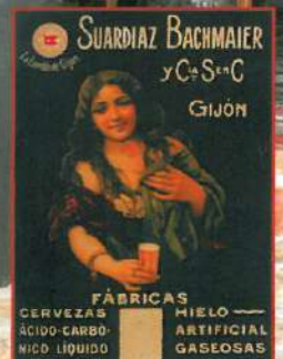
Cerveza hecha en Asturias