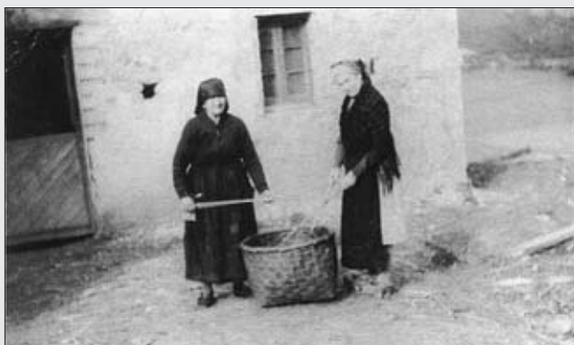
CON EL GOXU DE COYER PAN EN TRESCAÑO. FOTO ARCHIVO LA PIEDRIQUINA

Hacían cestos de carretera, macones, cestos para las patatas, para llevar la comida, goxes de coyer el pan. Algunas las hacían dentro del hórreo o panera, para almacenar allí el trigo, pues eran tan grandes que no cabían por la puerta.