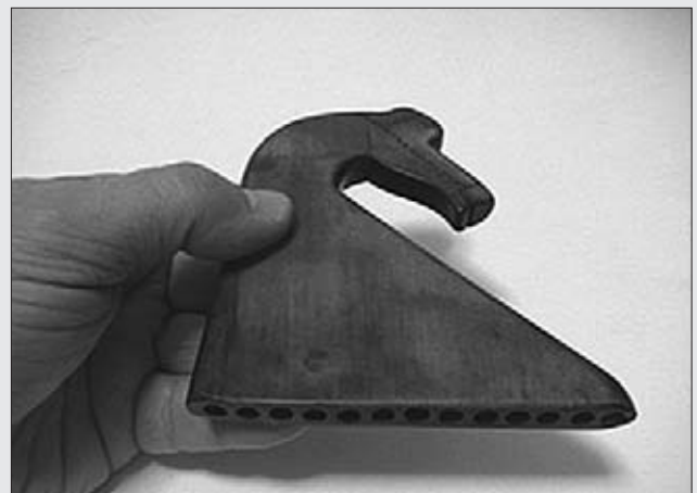
CHIFLO DE AFILADOR.

Cacharrerías/quincallerías , venían en burros y acampaban unos días en distintos lugares, por ejemplo, en Escamplero en El Trechoriu, y volvían cada 2