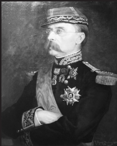
Louis Faiderbe, 1883. Musée de l'Armée (Invalides, Paris)