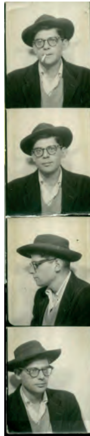
Imágenes de fotomaton de Allen Ginsberg , alrededor de 1950

Dijo el esqueleto TV Come decibelios Dijo el esqueleto Telediario Esto es todo Buenas noches.