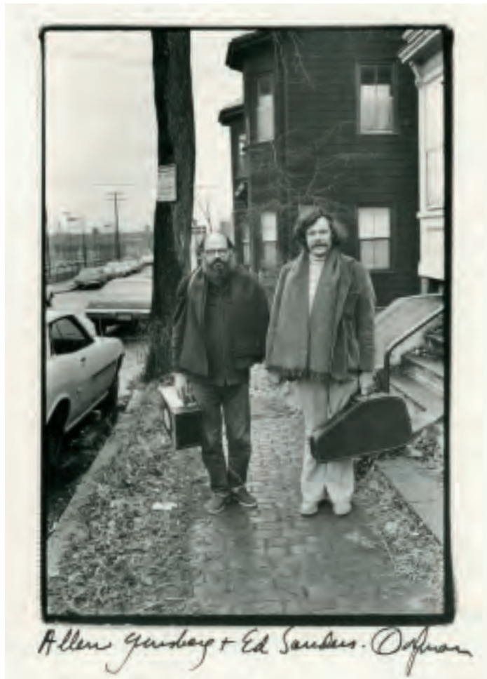
Allen Ginsberg con Ed Sanders.

salgo por la puerta de mi casa, giro a la derecha y camino hacia la Primera Avenida en Nueva York. ¿Qué es lo que veo? ¿Qué pasa con los autobuses? Están abriendo una zanja en la calle para meter una tubería nueva. Hay un tipo de cara colorada al que veo cada dos por tres. Entra y sale del psiquiátrico, según me ha comentado Peter Orlovsky. Vivía con su madre y ahora está en la calle, agitando una taza de metal para conseguir dinero para vino; se pone junto a la puerta de una iglesia, lo veo un día sí y otro no. O sea, todos los iconos. Hay una tintorería con la puerta abierta y un par de vagabundos puertorriqueños allí tumbados, entre los vapores que salen de la tintorería. Están allí a menudo, con aspecto enfermizo. Probablemente algunas noches se vayan a casa. Quería ver qué era lo particular de mi propio barrio, observándolo como tierra carnal, con sus cosas buenas y malas. Es muy interesante. Me di cuenta de que era el armazón de un poema épico, que podría englobar todo Nueva York, con recuerdos que tengo desde 1944. Pero lo acoté a mi manzana y después perdí impulso. Puede que vuelva a él.