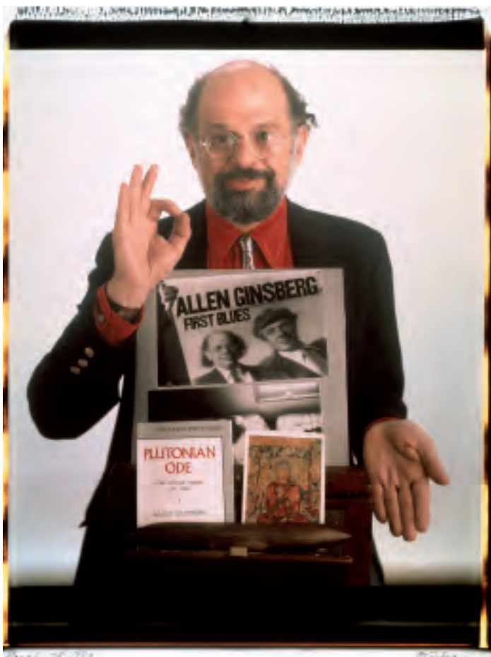
Allen Ginsberg, 28 de marzo de 1983.

vuelta por la ciudad. Me enseñó sus viejos andurriales, donde paraban los chavales y los sitios donde rodaba: el viejo hotel que utilizó en Mi Idaho privado... Pero lo que realmente me dejó alucinado fue River Phoenix en esa película. Pienso que la escena de la hoguera con River Phoenix y Keanu Reeves, en la que el chaperero abre su corazón, es realmente extraordinaria.