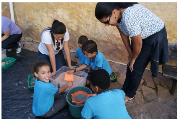
Figura 05 – Escavação simulada. Jun./2012.

Algumas providências devem ser tomadas para evitar qualquer tipo de constrangimento: (01) Todo o material é previamente esterilizado e higienizado em todos os momentos de uso. (02) A areia é esterilizada e, no final das atividades, a caixa é lacrada evitando contato com animais que possam transmitir doenças. (03) No início e término das atividades os alunos deverão lavar as mãos e utilizar álcool em gel. (04) Todas as etapas da atividade são acompanhadas por estagiários do Laep/Nugeo/UFVJM.