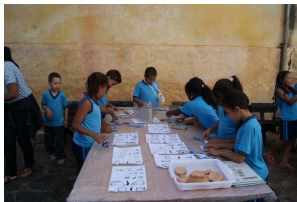
Figura 07 – Oficina Laboratório Arqueológico.