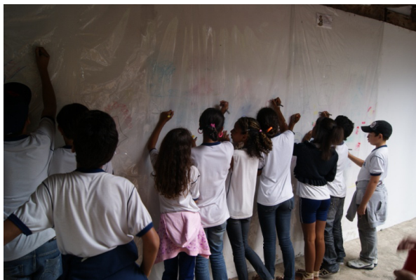
Figura 06 – Oficina de arte rupestre.

ocuparam a região, bem antes da chegada dos primeiros europeus.