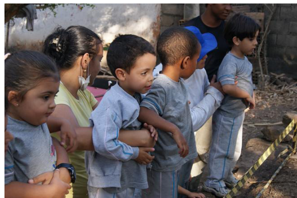
Figura 03 – Visita do Colégio Acalanto, Diamantina-MG. Nov./2011.

Para alunos dos ensinos Fundamental II e Médio (no Brasil, adolescentes entre 11 e 17 anos), a visita é precedida de uma pequena palestra (com duração máxima de 15 minutos), momento em que são feitos esclarecimentos básicos sobre qual o papel social da Arqueologia e o que é uma escavação arqueológica.