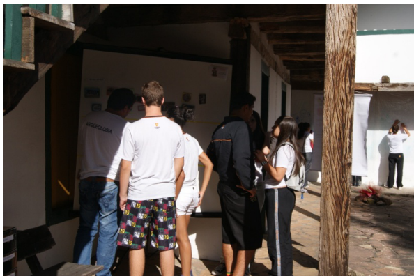
Figura 08 – Oficina Estratigrafia Arqueológica. Fonte Laep/UFVJM, 2011.

Há uma dificuldade muito grande para crianças e adolescentes compreenderem o conceito de tempo, principalmente quando falamos em ocupações humanas que seguem entre 10 mil anos A.P até o presente. Outros conceitos utilizados rotineiramente em Arqueologia (relacionados ao tempo), também são de difícil compreensão: passado x presente; recente x antigo; pré-história x história; etc.