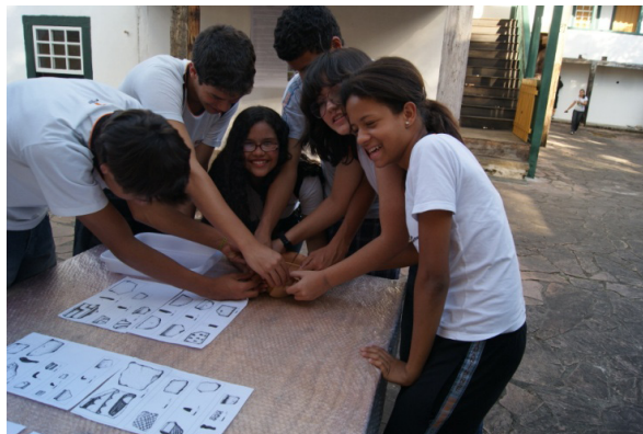
Figura 09 – Oficina Cerâmica.

Como material, é utilizado um vasilhame cerâmico recente que é quebrado pela equipe (obtendo-se cacos grandes), e elásticos. É solicitado para as crianças e adolescentes a remontagem do vasilhame, atividade que envolve de “várias mãos”, ou seja, sem o auxílio de outros colegas, a remontagem fica quase impossível. Os alunos têm de se organizar de tal forma que só conseguem concluir a tarefa com o auxílio de todos.