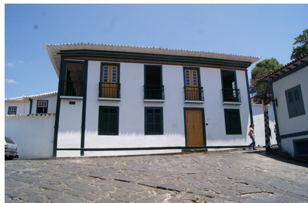
Figura 02 – Casa da Chica da Silva, sede do Iphan em Diamantina-MG.

Além do patrimônio histórico-cultural, devemos ainda citar a relevância da região em termos ambientais: geológicos, de cobertura vegetal e fauna; ou seja, um riquíssimo ecossistema com vasta possibilidade de trabalhos de ensino, pesquisa e aproveitamento turístico.