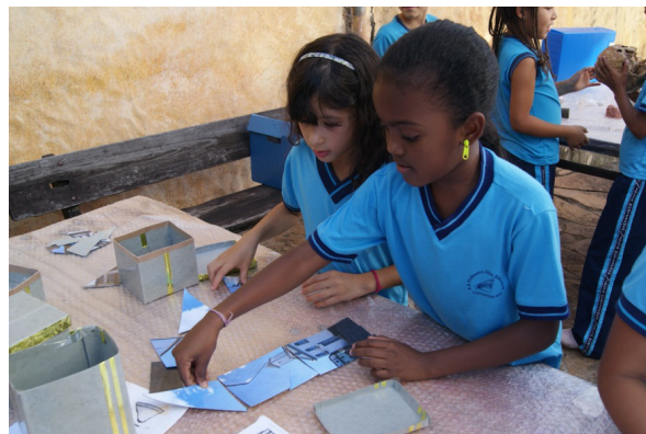
Figura 10– Oficina, Jogos e atividades recreativas (atividade com quebra-cabeças). Fonte LAEP/UFVJM, jun./2012.

Busca-se, assim, que todos possam se apossar deste patrimônio, visto como parte da história diamantinense.