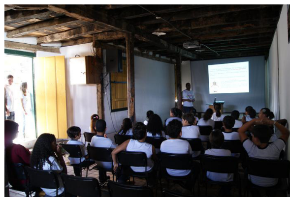
Figura 04 – Palestra introdutória, Diamantina-MG. Nov./2011