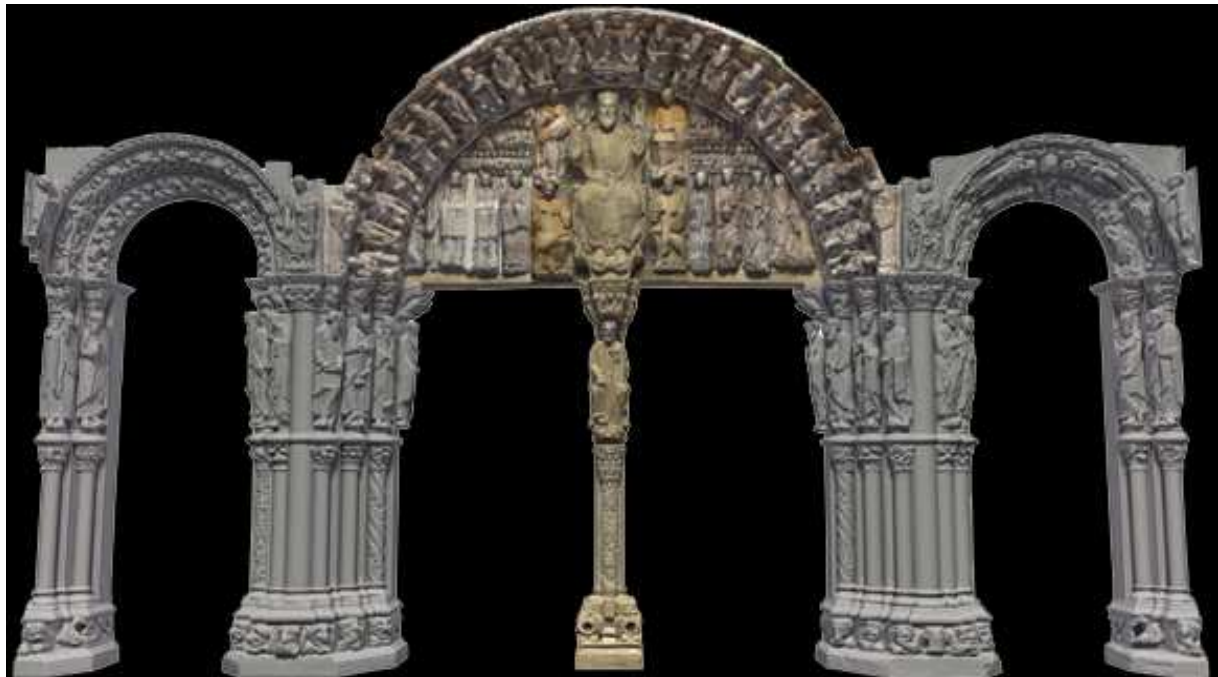
Figura 1. Detalle de la 1ª fase de ejecución del proyecto Pórtico Virtual

Key words: VIRTUAL RECONSTRUCTION, MUSEUM TECHNOLOGY, HCI