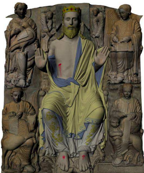
Figura 4. Reconstrucción de la capa original de policromía del Pantocrátor basada en los trabajos de restauración.

La aplicación se implementa en base al paradigma de computación distribuida teniendo dos componentes fundamentales: un sistema de control y un sistema de visualización, siguiendo el modelo clásico cliente-servidor. El sistema de control tendrá carácter de cliente, mientras que el sistema de visualización hará las funciones de servidor. Este planteamiento resulta necesario, entre otros factores, debido al balance de carga computacional que se ha de establecer, dado que el sistema de visualización soporta una carga gráfica elevada.