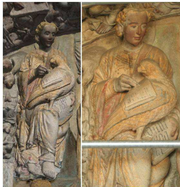
Figura 3. Resultados de la fase de texturizado. Izquierda Modelo 3D texturizado del Apóstol San Juan. Derecha: Fotografía de la misma escultura en su emplazamiento en el Pórtico.

Teniendo en cuenta los objetivos y requisitos enunciados en el apartado 2, se concibe la aplicación, de forma conceptual, como un sistema de exploración virtual interactiva del Pórtico de la Gloria. Para ello, como ya se ha comentado, se divide el monumento, teniendo en cuenta la alta carga simbólica del mismo y diversos factores de relevancia histórica o cultural, en un conjunto de 11 zonas de interés, que los usuarios de la aplicación podrán visualizar y explorar a demanda, a la vez que escuchan una serie de locuciones relativas a cada una de las zonas, en las que se explican el significado de cada zona, junto con diversas consideraciones históricas, y referentes a la conservación y restauración del monumento.