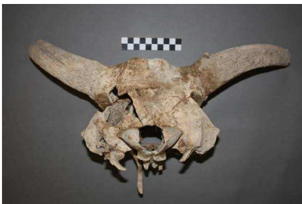
Figura 3: Cráneo de Bos taurus del yacimiento calcolítico de La Gallega (Valencina de la Concepción, Sevilla).

El análisis de este material orgánico no sólo nos señala a las especies domesticadas, recolectadas o cazadas que permitían la supervivencia, sino que nos indica además cómo no dejamos de ser los carroñeros de hace un millón de años. Para reconocer que esta paleobasura es un patrimonio importante debemos saber qué guarda de nuestro pasado.