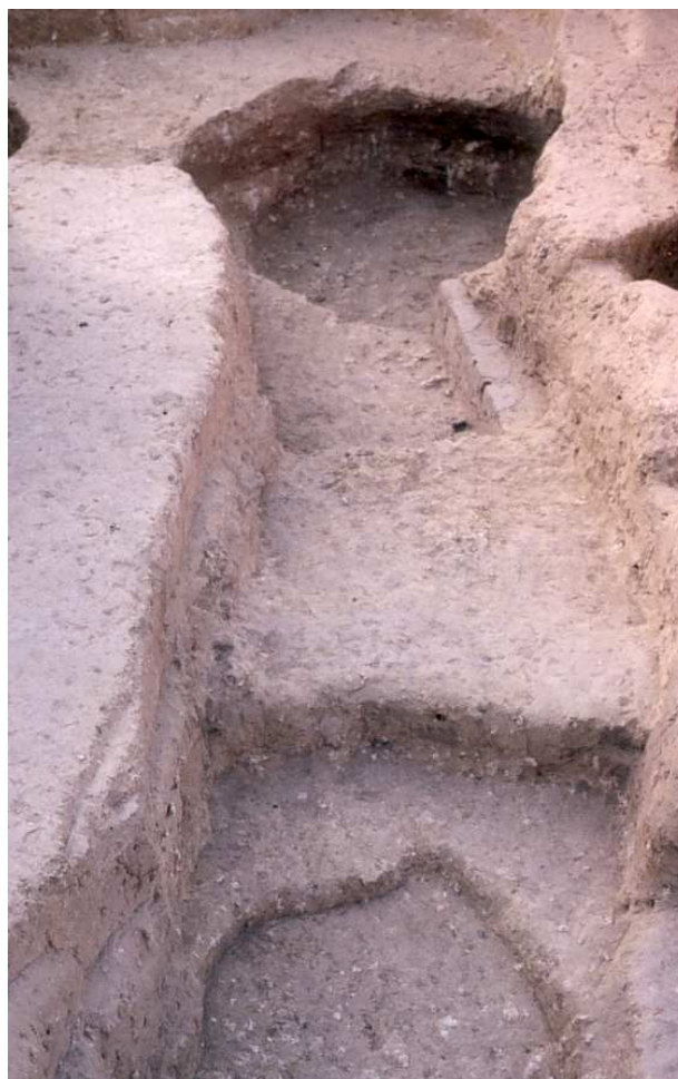
Figura 2: Estructura excavada en el yacimiento calcolítico de La Gallega (Valencina de la Concepción, Sevilla).

El último fósil bandera seleccionado será una falange I de vaca con más de 4.000 años de antigüedad procedente del poblado calcolítico de Valencina de la Concepción de Sevilla (Figuras 2 y 3; Martín y Ruiz, 1992) que representará el máximo grado de evolución de nuestra especie a través de la domesticación de especies animales y vegetales (ganadería y agricultura). Unas actividades que comenzaron hace casi 11000 años. Serán las últimas investigaciones realizadas en ADN antiguo (CEIRIDWEN et al. , 2004) las que nos van a permitir medir la importancia de África en nuestra península hace 5000 años y lo que esto significa en la evolución trófica de las poblaciones humanas de nuestro territorio.