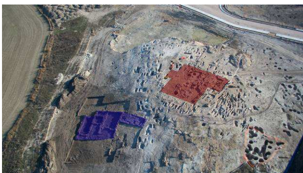
Figura 2. Foto aérea del yacimiento. En rojo la iglesia y en azul las viviendas

Tal y como hemos apuntado, la ocupación en el pago conocido popularmente como La Poza se inaugura con la construcción de un pequeño templo de época hispano-visigoda cuya cronología ronda aproximadamente los siglos VI y VII d. C. Levantado en la cima de un pequeño cotarro que se eleva por encima de un bodón estacional, no debió de funcionar como parroquia hasta el siglo XI, momento en el cual se conforma buena parte del yacimiento arqueológico tal y como ha llegado hasta nosotros en la actualidad (MARTÍN, SAN GREGORIO, 2011: 80-89).