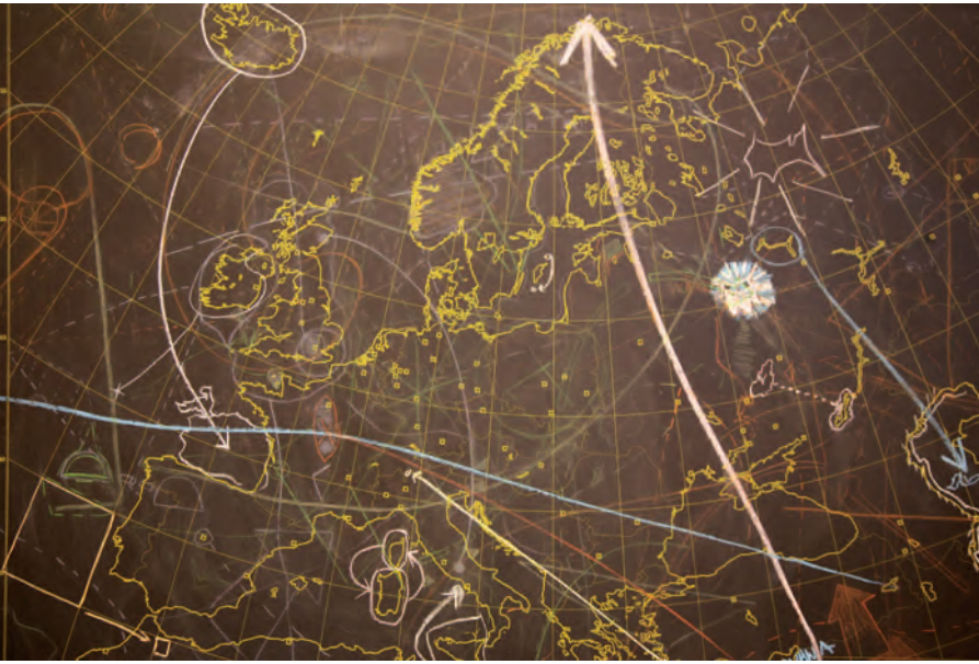
George Brecht, Sin título , 1970

Una exposición no debe tratar de tomar el poder sobre los espectadores, sino proporcionar recursos que incrementen la potencia del pensamiento.