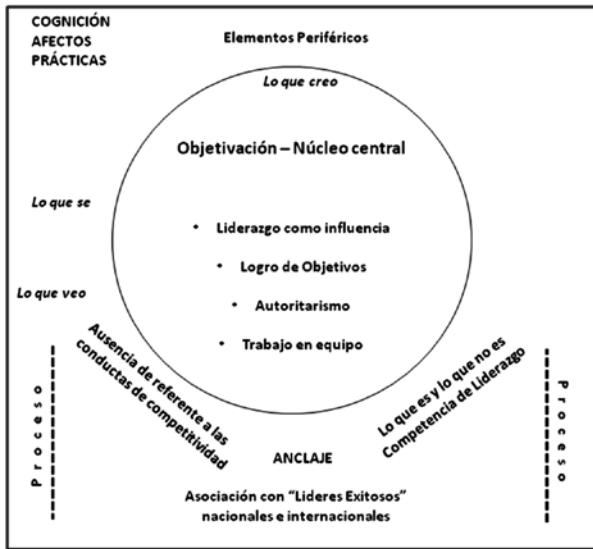
Ilustración 2: Representaciones Sociales sobre la Competencia de Liderazgo 4