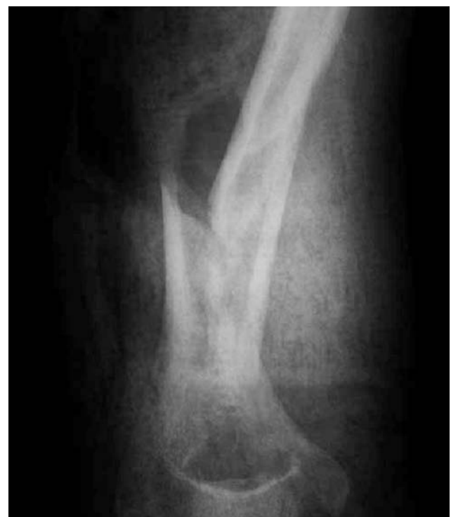
Figuras 1 y 2.- Foco fractuario preoperatorio con férula de yeso neutralizadora.