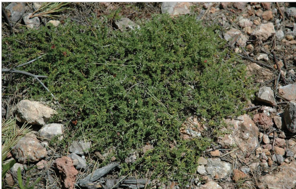
Fig. 2. Hábito de Thymus vulgaris subsp. mansanetianus (Tavernes de Valldigna, localidad tipo).