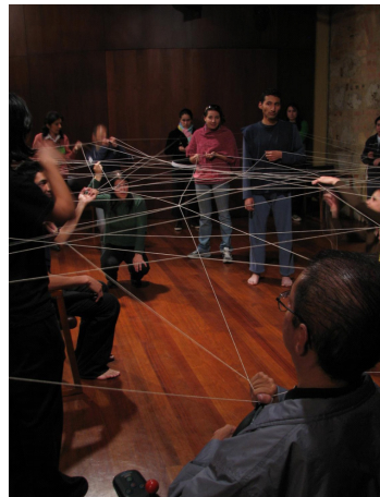
Imágenes del proceso formativo en artes visuales. Laboratorio Bogotá (2008). Archivo particular, Colectivo Otro. Derechos de imagen cedidos al Ministerio de Cultura.