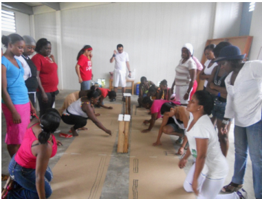
Imágenes de proceso formativo en artes visuales. Laboratorio Chocó (2012).

Este aspecto quizás es el que tiene mayor fuerza dentro del sentido que tiene para mí ser docente. La disposición del encuentro hacia el otro finalmente revierte hacia uno mismo, allí media lo afectivo. Lo que se construye con otros no se reduce a las muestras y exposiciones finales, la dimensión procesual de las mismas es la que le otorga significado al encuentro.