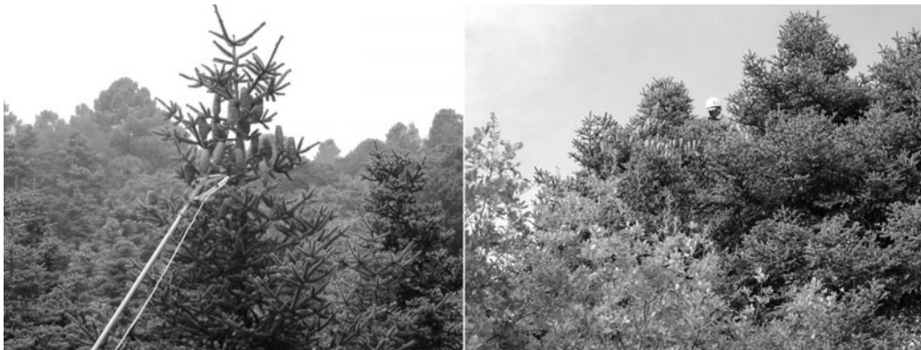
Figura 1. Muestra del sistema de recolección según la altura de los árboles

Se analizaron 10 megagametofitos maduros por cada árbol (Tabla 1). En una primera fase,