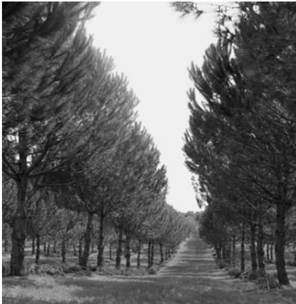
Foto 2. Cultivo mixto intensivo piñonero-cereal (Montemor-o-Novo, Portugal)

A favor del empleo de pinos injertados frente a brinzales obtenidos de semilla está la posibilidad de contar, en un futuro próximo, con materiales de base (clones) catalogados en la