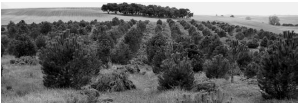
Foto 1. Pinares-ista entrepanados entre tierras de secano, resultado bien de sustituir viñedos devastados por la filoxera en el s. XIX o bien de la forestación de tierras agrarias en el marco de la PAC a partir de 1993, recibiendo actualmente los primeros clareos (Rueda, Valladolid)

Sin embargo, a diferencia de otros árboles frutales o productores de frutos secos del viejo mundo, esta especie no ha sido domesticada y carece de variedades o cultivares definidos. Las razones podrían ser varias. Por una parte, su selección o mejora genética es relativamente