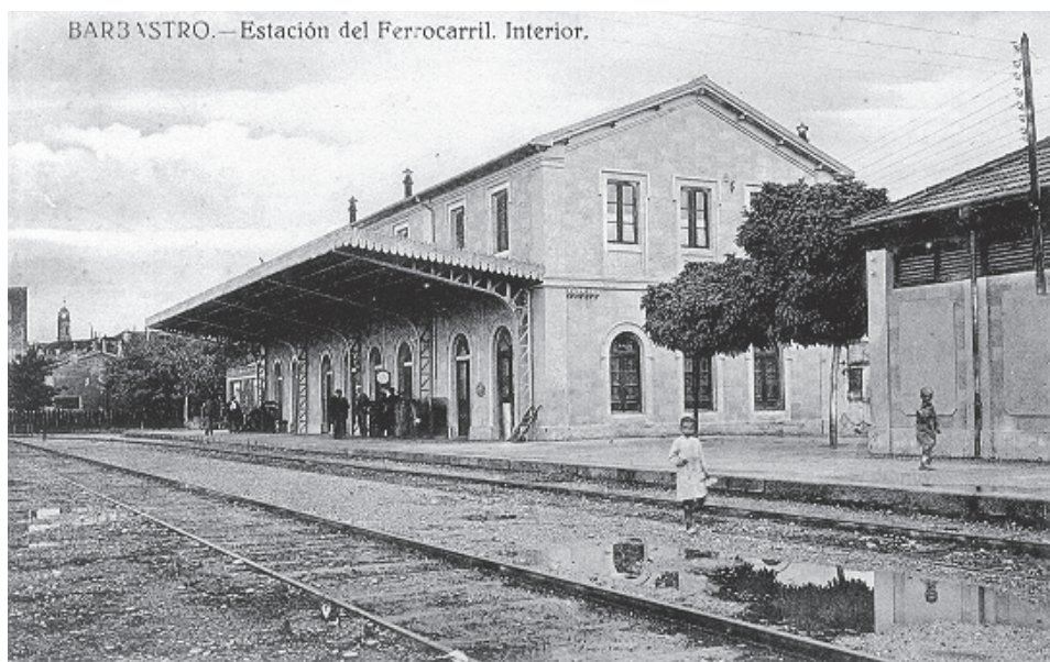
Estación de tren Barbastro, hoy desaparecida.