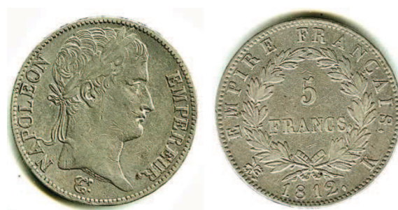
Fig. 3: cinco francos de Napoleón I. Moneda francesa, del tipo de las acuñadas, con ligeras variantes, entre 1806 y 1815. Similares reversos se usaron desde las primeras acuñaciones de la revolución, y habría inspirado el reverso de las acuñaciones barcelonesas, entre 1808 y 1814. Colección del autor.

Parece claro que, aunque no lo mencione explícitamente, considera como más importante o “anverso” a la cara de la moneda en que aparece el escudo de Barcelona, en tanto que si menciona al “reverso”;