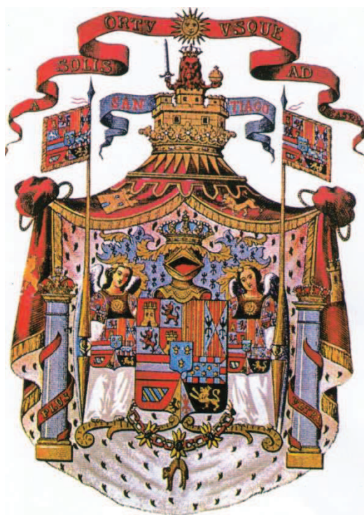
Fig. 7: Escudo "grande" de Felipe V. con ligeras modificaciones, se usó hasta Fernando VII.

Uno de los tantos cambios introducidos por el primer Borbón que reinó en España, con el nombre de Felipe V, fue la introducción de un elaborado escudo, en el que figuraban todos sus dominios, reales o pretendidos, flanqueado por dos tenantes, especie de ángeles, que en la parte delantera de sus vestimentas lucían un Sol radiante, representado siempre con mas de los 16 rayos heráldico (generalmente, 32) y, como pieza de mayor jerarquía, surmontando el todo, el Sol sobre una cartela de gules, con la leyenda: “A solis ortu usque ad occassum”, tomado del salmo de Asaf 49, en referencia a extenderse de un extremo al otro de la Tierra los dominio de la Corona 18 . Lo que viene a poner el punto final al por qué de tal proliferación de soles, de la que se hizo hasta aquí apretada síntesis