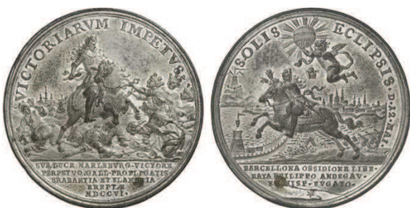
Fig. 6: Acuñaciones durante la Guerra de Sucesión. Solis eclipsis : Mientras John Churchill, duque de Marlborough, mas conocido luego como Mamburú, cabalga victorioso, Felipe huye de Barcelona. Lo hace en medio del eclipse que provoca un ángel, tapando el Sol con las armas de Austria