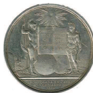
Fig. 9: Reverso de la medalla celebrando la promulgación de la Constitución de 1812. En el emblema de las Cortes de Cádiz, España (o Marte, según versiones) y las Indias se dan la mano, bajo el "astro brillante". Colección del autor.

El Sol, ya sea el incaico o el de Borbón, ya no es la esperanza de un nuevo amanecer, sino la realidad de un nuevo día; por eso se lo excluye del “sello”, y se lo pone completo, como figura de máxima jerarquía, representación de la soberanía en sí misma y, por lo tanto, de mayor importancia que ningún “sello” provincial. En el anverso, claro está.