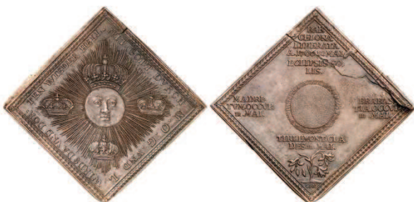
Fig. 5: Acuñaciones durante la Guerra de Sucesión. Barcelona liberata: El Rey Sol, centro del universo, a cuyo alrededor giran las coronas de Europa...y el Sol eclipsado, sobre flores de lis marchitas

Mínguez ha tenido solamente en cuenta lo acontecido en la Nueva España, sobre todo en México; y apenas ha mencionado a las medallas. De ellas, tan solo las juras reales, destacando como su período de esplendor la última parte del siglo XVIII y los primeros años del XIX: No registra para nada las medallas europeas de la Guerra de Sucesión.