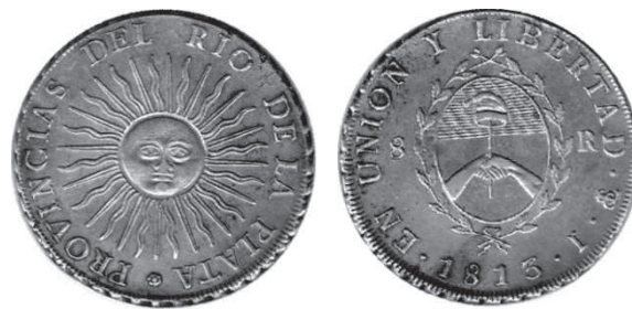
Fig. 4: Ocho Reales potosinos de 1813. Acuñación autónoma rioplatense. Colección del autor.

“...La moneda de plata que de aquí en adelante debe acuñarse en la Casa de Moneda de Potosí, tendrá por una parte el sello de la Asamblea General, quitado el Sol que lo encabeza; y un letrero que diga alrededor: Provincias del Río de la Plata; por el reverso un Sol que ocupe todo el centro, y alrededor la inscripción siguiente: En Unión y Libertad; debiendo además llevar todos los otros signos que expresen el nombre de los ensayadores, lugar de la amonedación, año y valor de la moneda y demás que han contenido las expresadas monedas ” (subrayado del autor). Claramente, el “reverso” está tomado como el “revés”, el “otro lado” del que describe en primer término, por considerarlo tal vez, solo tal vez, de mayor importancia, pero al que no llama “anverso”, al igual que Ezpeleta a la barcelonesa. El Sol fue desalojado de su lugar en el “sello”, pero no porque no fuera importante, sino para darle un lugar más destacado en la moneda.