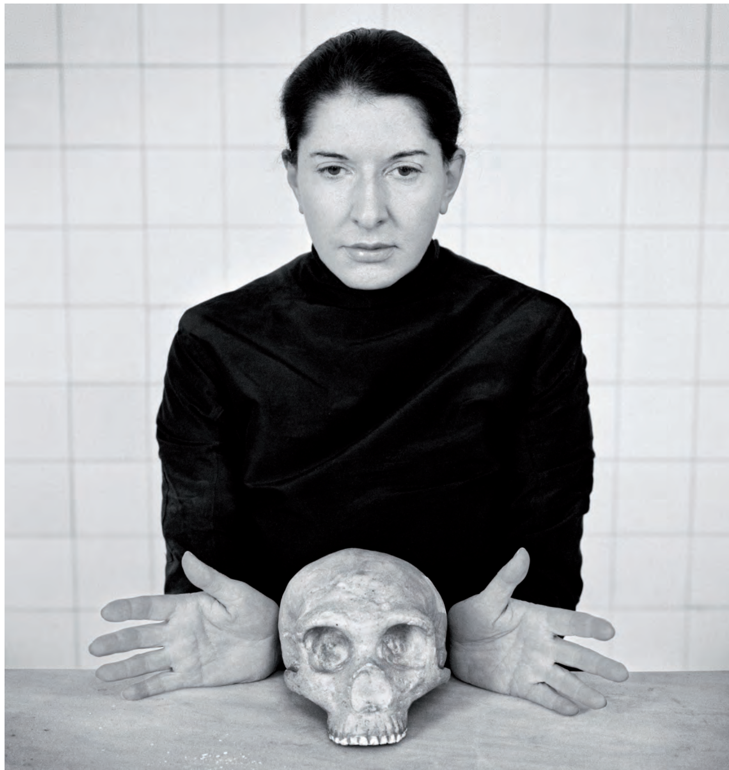
Una versión previa y más extensa de este texto se publicó en Boletín Hispánico Helvético , nº 13-14, 2009.