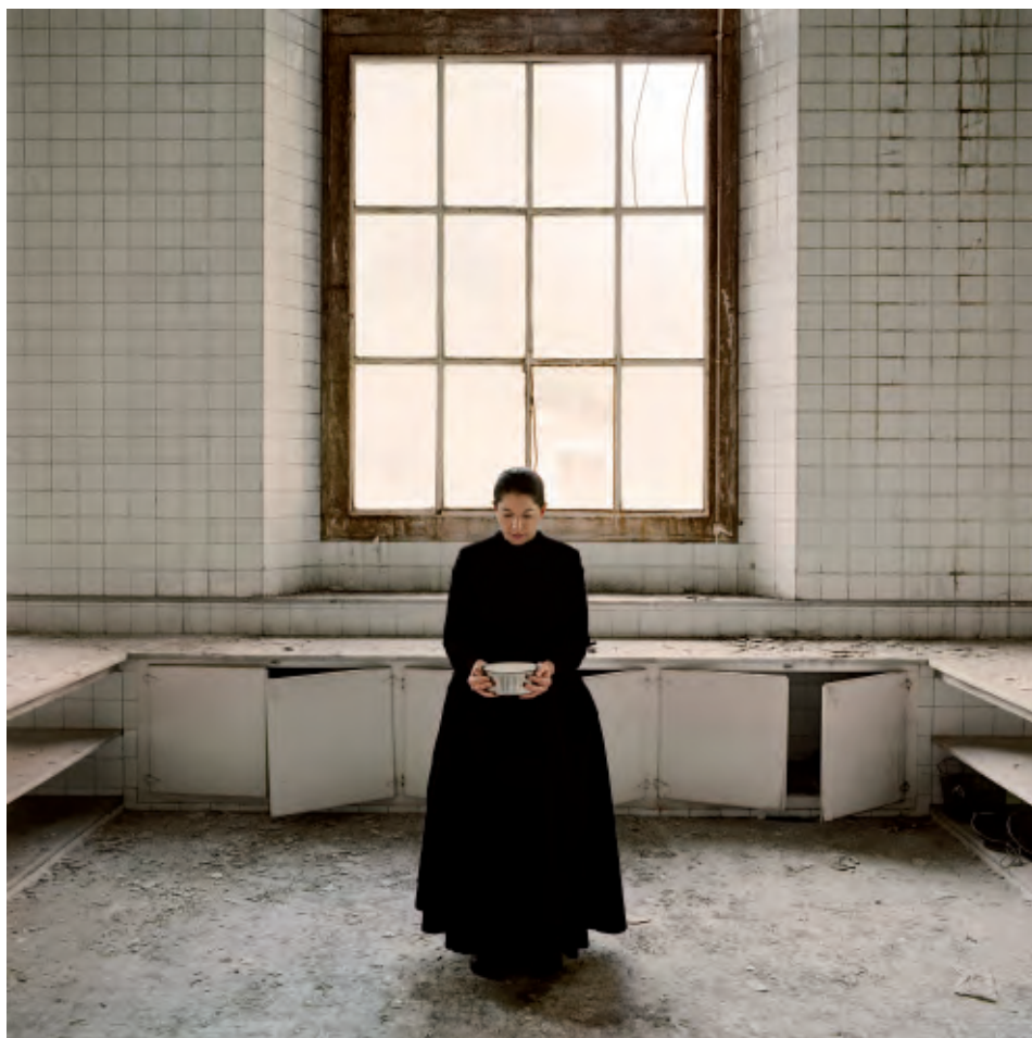
Marina Abramovic, The Kitchen V, Homage to Saint Therese , 2009

Términos como «masculino» o «femenino» están notoriamente sujetos al cambio; existen historias sociales para cada uno de esos términos; su significado cambia radicalmente según las fronteras geopolíticas y las obligaciones culturales que determinan lo que imagina el otro (quién imagina a quién) y con qué finalidad. Los términos de la designación de género nunca se fijan de una vez y para siempre, están continuamente en proceso de remodelación. Este rehacer que recae a la vez sobre el género y sobre la organización de la sexualidad se produce en los momentos de conjunción y de disyunción que definen corrientemente el campo de la política sexual. El futuro que le espera a la política sexual dependerá de nuestra capacidad para vivir y negociar estas tensiones, sin reprimirlas mediante posiciones dogmáticas o soluciones demasiado fáciles.