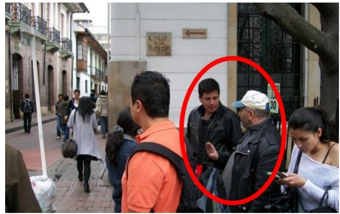
Fotografía 5. Pregunta a terceras personas.