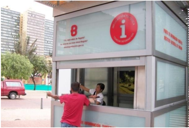
Fotografía 3. Punto de información. Junto a la estación "Las Aguas", TransMilenio.

47% correspondió a aclarar la ruta a seguir, discriminado de la siguiente manera: 20% en puntos críticos, y 27% en pregunta a terceros.