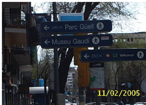
Fotografía 1. Señalización que informa de la localización de una estación cercana del sistema metro, Barcelona, España.

se convierten en puntos de referencia para la ubicación del usuario en el entorno urbano 5 .