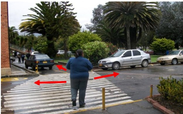
Fotografía 4. Punto crítico. 3 opciones para continuar el recorrido.

Las cifras anteriores concluyen que la falta de información a la movilidad externa de locaciones de alta asistencia de usuarios ( universidades en el caso de la presente investigación ) aumenta el recorrido peatonal en un 60% más de tiempo, y de ese tiempo adicional, el 43% corresponde al tiempo invertido en orientación del usuario en la zona de destino ( entre puntos críticos, preguntas a terceras personas, y puntos de información ).