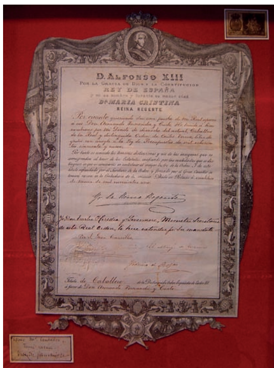
Fig. 4. Nombramiento de Armando Fernández Cueto como Caballero de la Orden de Carlos III. 1901. Biblioteca de la Escuela de Artes y Oficios de Avilés.

caces pero significativamente más económicos que los de un arquitecto también tuvieron que ser razones de peso en este éxito. Igualmente, la competencia con los arquitectos y entre los propios maestros de obras por captar clientes los obliga a ofrecer novedades y a estar al día de avances técnicos y modas formales. El resultado es una imagen de profesional fiable determinada por unos resultados prácticos que se imponen a la titulación. De hecho, el mérito creativo reflejado sobre un papel en el proyecto queda en la práctica subordinado a la capacidad para llevar a término su ejecución de manera rápida, segura y acorde con lo presupuestado.