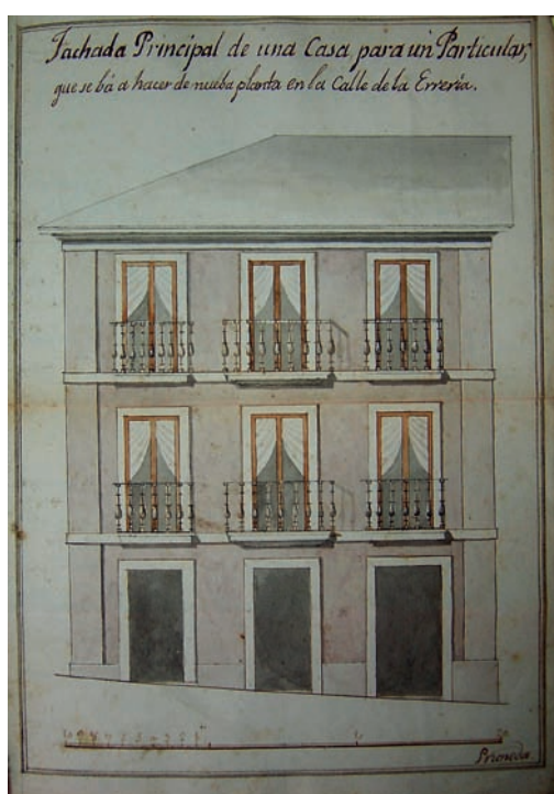
Fig. 1. Francisco Pruneda hijo, proyecto para un edificio de viviendas en la calle de la Ferrería (hoy calle Mon, nº 8), Oviedo. H. 1835. Archivo Municipal de Oviedo.

co. La razón principal va a estar en un factor clave: la falta de titulados superiores hará que los maestros de obras cobren un progresivo protagonismo.