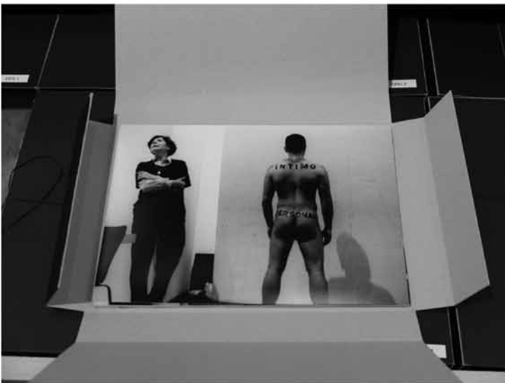
Tres vistes de l'exposició Re.act.feminism a la Fundació Tàpies. Vista general, vista d'una taula amb una usuària i interior d'un arxivador amb fotos d'una acció d'Esther Ferrer.

si bé ens recorda una altra mostra històrica i monumental que es va presentar al MACBA l'any 1998, Out of actions , que també partia de Jackson Pollock i l' action painting , com a referència d'un art d'acció. En tot cas, l'exposició de la Fundació Miró, malgrat que és més petita, aporta un capítol particular i interessant sobre el grup japonès Gutai, fundat l'any 1954 i pioner en l'art d'acció com un art "concret", una paraula que en el nostre vocabulari tradueix el concepte japonès Gutai.