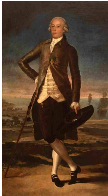
Fig. 1. Retrato de Jovellanos por Francisco de Goya y Lucientes, c. 1783. Propiedad: Depósito del Estado por dación en pago de Hidroeléctrica del Cantábrico en el Museo de Bellas Artes de Asturias, Oviedo. Col. Museo Nacional de Escultura (Valladolid).

Para adquirir la pintura de Goya se empleó de nuevo la fórmula de la dación, pero esta vez en concepto de liquidación del Impuesto de Sociedades, merced a un acuerdo con la firma asturiana Hidroeléctrica del Cantábrico que abonó los quinientos millones de pesetas apercibidos pasando así la pintura a manos del Estado Español, que la vinculó al mismo museo vallisoletano y la ingresó en el centro ovetense como depósito indefinido en el mes de abril de 2000 4 .