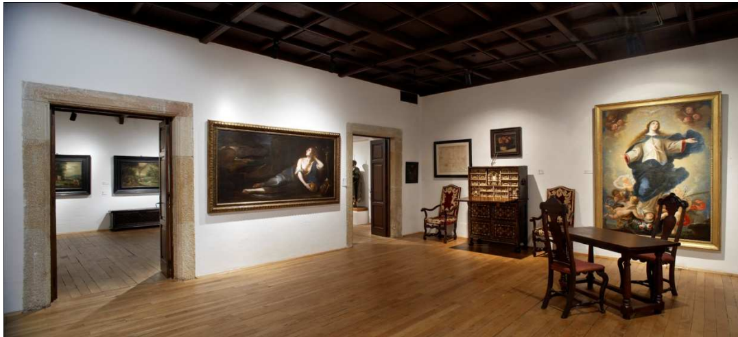
Fig. 5. Vista interior de las salas dedicadas a Jovellanos.

la donación del pintor Ángel García Carrió 34 , además de treinta fotografías de la desaparecida Colección de Bocetos de Jovellanos y algunas antigüedades arqueológicas y mobiliarias 35 (de las que una parte estaba vinculada a la casa. Había, de este modo, una mezcla de objetos que recordaban la figura de Jovellanos y bosquejaban aún de un modo muy parcial la evolución de la pintura asturiana 36 . La estructura de la recreada vivienda de Jovellanos condicionaba el museo, en realidad, una colección de colecciones 37 .