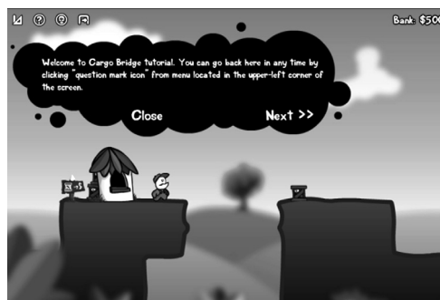
Figura 2. Cargo Bridge