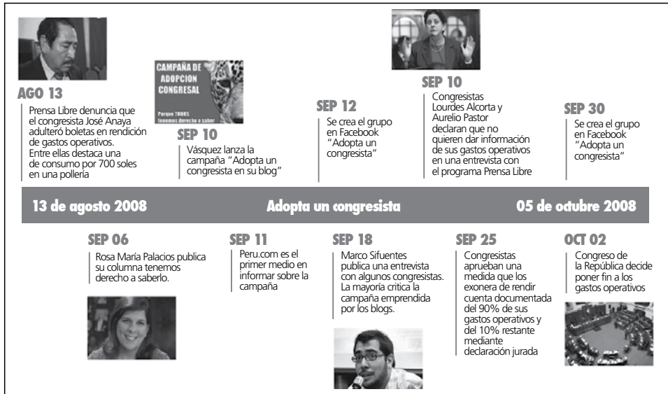
Figura 2: línea temporal de la campaña “Adopta un congresista”.

Al revisar el contenido de ambas campañas, se realizaron líneas de tiempo para identificar los momentos más relevantes de los dos casos, además de una fecha de inicio y de finalización: