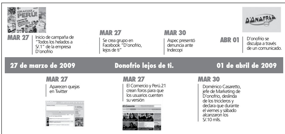
Figura 3: línea temporal de la campaña “D’Onofrio, lejos de ti”.

De esta forma, se analizó “Adopta un congresista” (figura 2) desde el 6 de septiembre al 5 de octubre del 2008. Por otro lado, “D’Onofrio, lejos de ti” (figura 3) tuvo un periodo más corto: del 27 de marzo al 2 de abril del 2009.