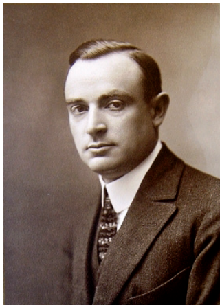
Figura 1. Foto de Julio Palacios (1916), tras acceder a la cátedra de termología de la Universidad de Madrid.

Ciencias de la Universidad y continuó con sus investigaciones en el Laboratorio de Investigaciones Físicas de la JAE. En 1919 publicó sus primeros artículos sobre isoterma del neón, desde 10 °C a -217 °C, en colaboración con H. Kamerlingh Onnes y C. A. Crommelin. 3