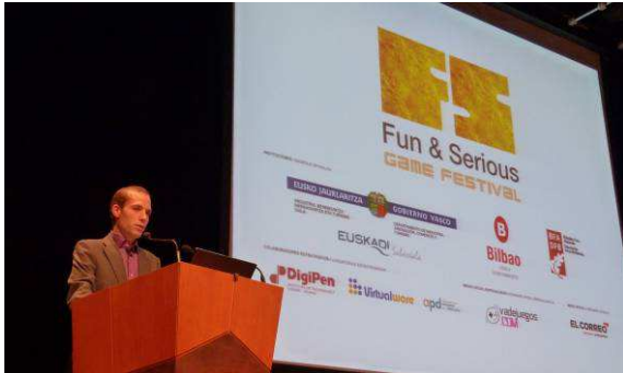
Figura 2. La educación y la cultura tuvieron un peso importante en el 1º Congreso Internacional Fun & Serious Game Festival (Bilbao, 2012).

Estas premisas se presentan como una herramienta inmejorable para poner la cultura en manos de la sociedad haciendo uso de las TIC.