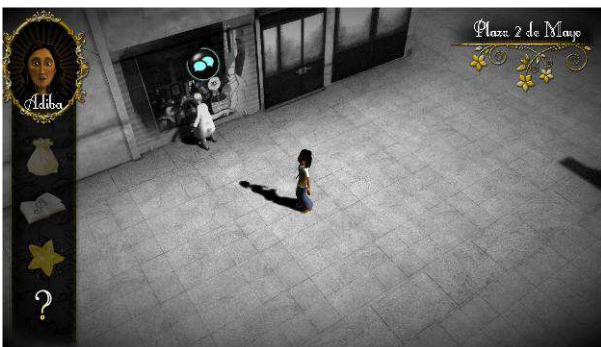
Figura 3. Avatar se encuentra en el 1º escenario a Picasso "pintando" un cuadro que no le pertenece.

La pérdida de la memoria cultural es hilo que conduce la historia, siendo el propio jugador el responsable de reconocer y devolver a los diversos elementos culturales a su lugar y época, tejiendo de esta manera los caminos de la cultura de España.