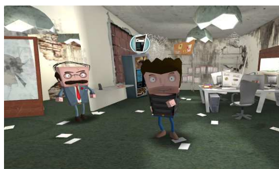
Figura 1. Lanian - Serious Game de emprendizaje.

“Los ordenadores y los videojuegos no son tan malos como se dice” Marc Prensky, especialista en videojuegos y aprendizaje (PRENSKY, 2005).