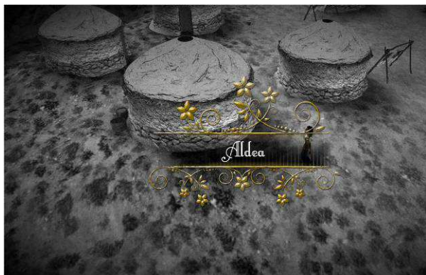
Figura 5. Poblado neolítico de escenario de SUM.

Todo ello en 3D y de manera interactiva para conseguir que Don Quijote de la mancha recuerde quien es y dónde podrá encontrar a su amada Dulcinea.