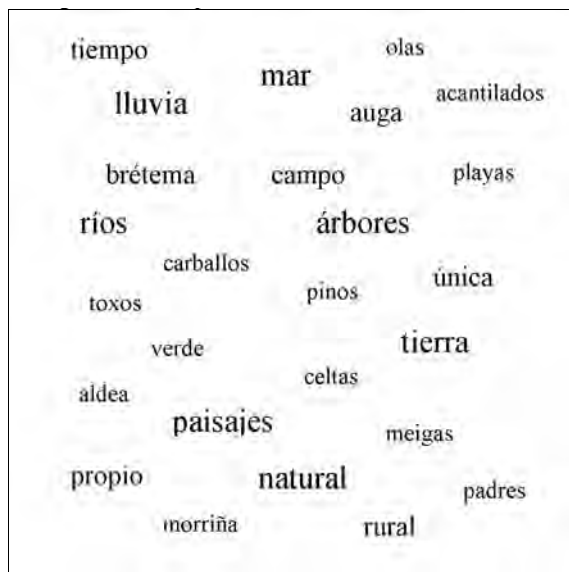
Figura 4. Descriptores de Galicia en el entorno Web.

a una interacción crítica con retroalimentaciones prácticamente instantáneas ( http://blogs.lavozdegalicia.es/globalgalicia/ ).