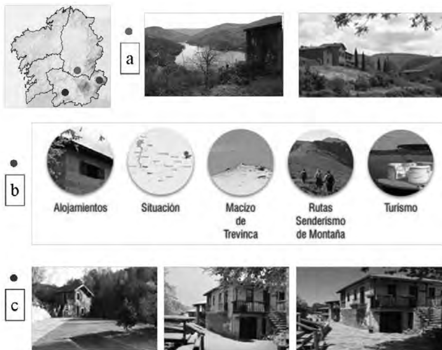
Figura 3. Configuraciones (a) venta de aldeas abandonadas, (b) promoción de actividades en montaña, (c) reconstrucción del medio rural.

vía efectiva un proceso de reconstrucción y de asignación de nuevos valores; así sucede con la transformación de la naturaleza hostil en un entorno singular para el tiempo de ocio ( http://www.cousogalan.com/ ). En último término, la progresiva ralentización funcional de una configuración territorial introduce la transposición de contenidos y de símbolos mediante procesos de sustitución. De estos procesos resultan configuraciones que si bien revalorizan una función previa, representan una pérdida de identidad al integrar referentes antónimos del sentir y del ser genérico. Lo refleja la promoción de algunos establecimientos termales en la provincia de Ourense, territorio rico en recursos de aguas minero-medicinales que han sido utilizados tradicionalmente por sus propiedades homeopáticas ( http://www.termasprexigueiro.com ).