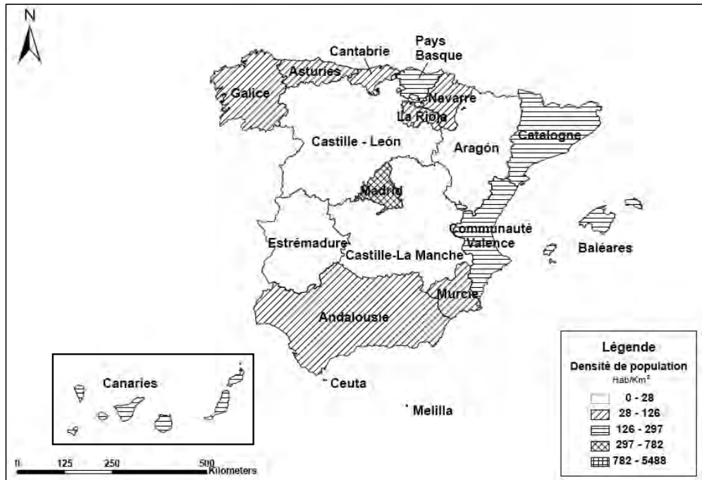
Figure 3. Differences regionales, le pourcentage d'étrangers sur la population totale.