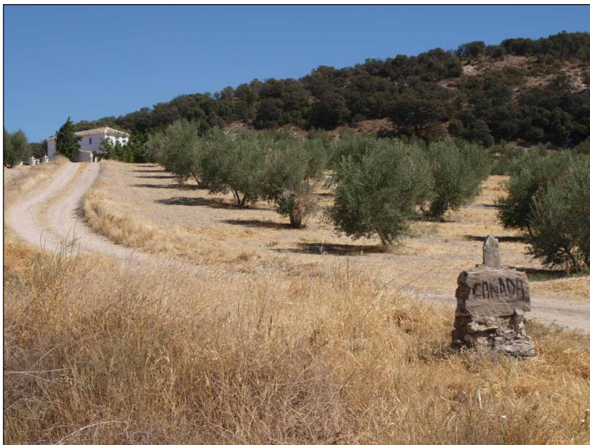
Lámina III. Cortijo Cañada ámbar (Fuente: Pedregosa Megías).

la compra del cortijo de Cañada Ámbar hasta su adquisición por el Sacro Monte. En relación con éste cortijo, «Bernardo Pérez —era propietario de un cortijo en el paraje de Cañada Ámbar —situado en la zona por donde Alcalá y Montefrío partían y parten sus términos— a mediados del siglo XVI». 49