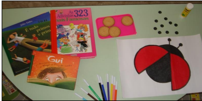
Figura 1 – Recursos da tarefa as pintas da joaninha (decomposição do 10 em dois conjuntos).

Recursos a utilizar: História Uma joaninha diferente (Melo, 2011); representação da joaninha em papel A4, cartolina preta, cola, objetos existentes na sala de atividades (livros, canetas de cor, bolachas, entre outros) (Figura 1).