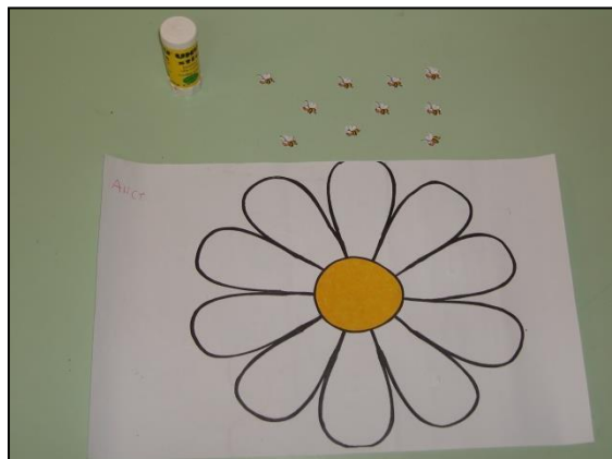
Figura 2 – Recursos da tarefa as pétalas (decomposição do 10).

Recursos a utilizar: Folhas A4 com a representação de uma flor com dez pétalas; abelhas em papel com uma dimensão que dê para colar dez abelhas numa só pétala – uma das hipóteses de distribuição das dez abelhas pelas pétalas; cola (Figura 2).