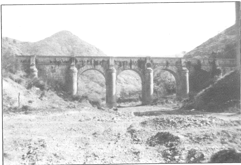
Vista del acueducto de Arroyo de Humaina.

1786 la cantidad necesaria para su culminación 4 . Éste mantendría su dirección hasta el año de 1804 que pasó al Colegio de San Telmo 5 , no obstante, en la etapa del consulado se marcaría las directrices en la reglamentación de la obra del acueducto 6 , además de la creación de una escuela de náutica que condicionaría este apartado para la terminación de la obra ingenieril entre otras circunstancias y que con posterioridad se adscribiría dichas enseñanzas al Colegio de San Telmo 7 .