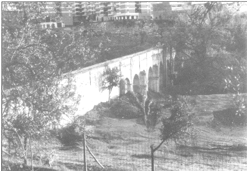
Vista del acueducto de Arroyo de Quintana o de los trece ojos .

En 1912 se procedió a la incoación del expediente de clasificación como benéfica-particular-docente y por R.O. de 17 de junio de 1914 se entrega al Ayuntamiento la dirección del Acueducto 11 , administración que volvió en