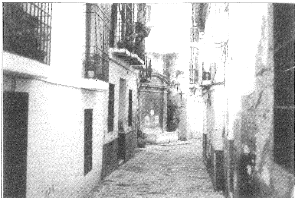
Fuente de Calle Los Cristos.

Éste, ha sido objeto por nosotros de su inventario cuando participamos en el Censo-Guía de Archivos de la Provincia de Málaga en 1982 y a través de unos criterios archivísticos de ordenación sistemática y siguiendo una clasificación analítica de resúmenes y métodos cronológicos, lo dividimos en tres secciones con 71 legajos y un total de 5.047 documentos. La primera