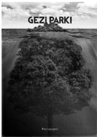
Imagen de la campaña #occupygezi

de la sociedad civil se había manifestado en los movimientos de justicia ambiental a nivel local y nacional. Durante las últimas dos décadas, las denuncias contra los impactos recientes y potenciales de la extracción de los recursos naturales, el cambio en el uso de tierra, la producción de energía y contaminación, fueron muy comunes e involucraron a comunidades locales desde la base, hasta a organizaciones de sociedad civil a nivel nacional e internacional. La gente estaba luchando por su sustento, por el derecho democrático de vivir en un ámbito sano y por el derecho de participar en el proceso de tomar decisiones sobre los proyectos de energía, minería, agua y transformación urbana. Sin embargo, como el prominente economista Daron Acemoglu 10 ano-