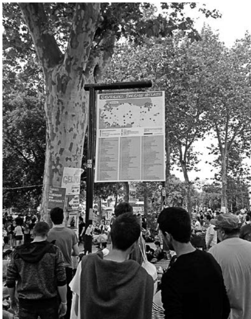
Exposición del mapa de conflictos ambientales en el parque Gezi (Autor: Serkan Kaptan)

Mientras el conflicto se va exacerbando, todavía existen especulaciones sobre el plan de la construcción, y el rol que este edificio podría tener en Taksim. ¿Cuál sería su función? ¿Cómo contribuiría a la vida urbana de los habitantes de Estambul? Nadie parece tener las respuestas. Lo más que se puede decir es que el primer ministro Erdogan todavía está indeciso –no sobre su construcción sino sobre su función. A principios de año, declaró que los planes de construcción contenían una zona residencial y un centro comercial. Después, anunció que Estambul era una metrópolis de primera categoría con pocos hoteles lujosos, y por ello el edificio nuevo de-