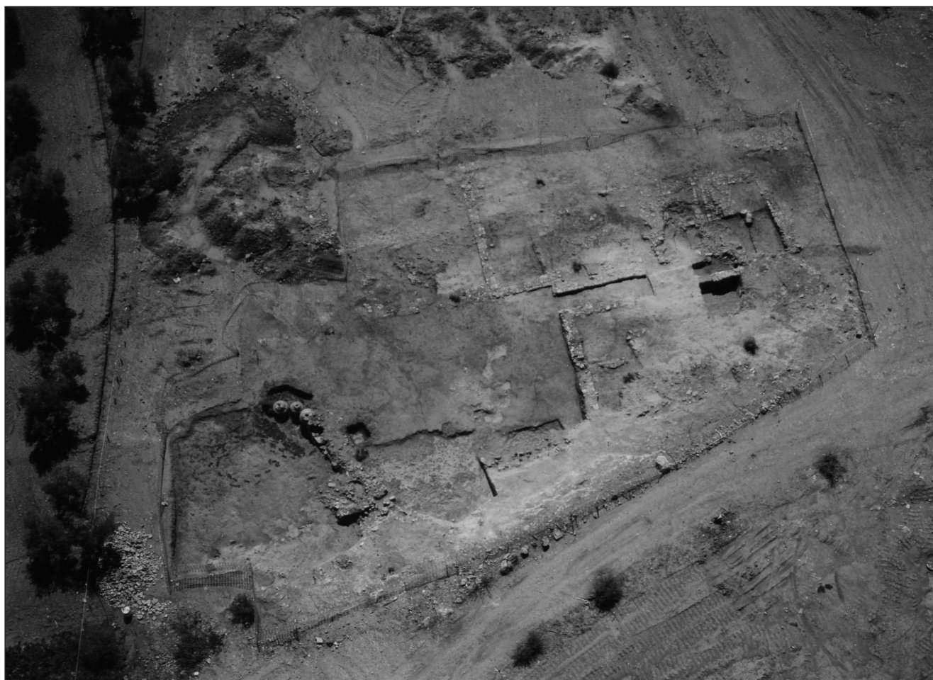
Lámina 2. Cerro Martos, Herrera (Sevilla). Detalle del área excavada.

En los dos niveles descritos en primer lugar, se levantaban tres edificios comunicados entre sí a través de dos pasillos, los cuales permitían también el acceso a otro más amplio probablemente pavimentado con pequeños ladrillos dispuestos sobre un nivel de explanación de arcilla roja –así lo indicarían los restos del suelo hallado en su zona central–.