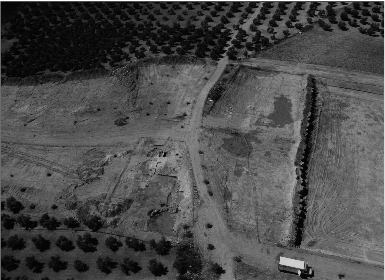
Lámina 1. Cerro Martos, Herrera (Sevilla). Vista general.

una planta de zócalos en relación ortogonal –prácticamente norte-sur y este-oeste– muy probablemente correspondientes a una misma unidad de explotación agrícola, aunque la carencia de límites perimetrales en el norte, noroeste, este y sur, junto con el arrasamiento total de algunas zonas interiores supone de hecho un sesgo muy importante a la hora de hacer cualquier valoración sobre el tamaño del asentamiento, así como sobre su categoría o significado desde el punto de vista económico en la zona. Esta carencia de límites, en el norte y noroeste, se relaciona sin duda con la presencia del Camino de la Genara que permitía el tránsito por la parte más alta del cerro y es probable que las ruinas del yacimiento hubieran servido tanto para asentar el camino como para repararlo cuando haya sido necesario. De hecho, su talud sur no era más que la continuación de una serie de unidades de destrucción formadas posteriormente y que apoyaban directamente sobre la costra