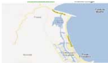
Figura 1. Imagen satelital del humedal laguna “La Reina”.

La laguna “La Reina” es un humedal marino costero ubicado en la región marino costera del estado Miranda, cercano a las poblaciones de Higuerote y Carenero (ver Figura 1).