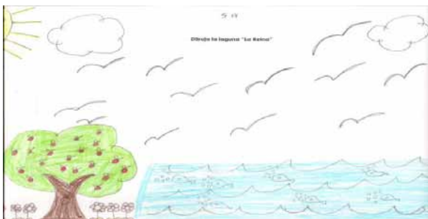
Figura 3. Dibujo realizado por sujeto 3 (10 años), donde se evidencia la presencia de los elementos naturales más comunes: agua, árboles, peces y aves

En este aspecto se puede apreciar que los estudiantes realizaron la representación de animales donde destaca el valor de su experiencia en el humedal, por lo que se puede inferir que los niños poseen interés por estas especies, ya que las asocian a ideas y uso en su propio entorno. Esta inclinación se encuentra asociada a una predisposición para comportamientos favorables con su entorno, ya que dan a conocer que este espacio es poseedor de una gran diversidad de especies (Borgues y da Conceicao, 2006).