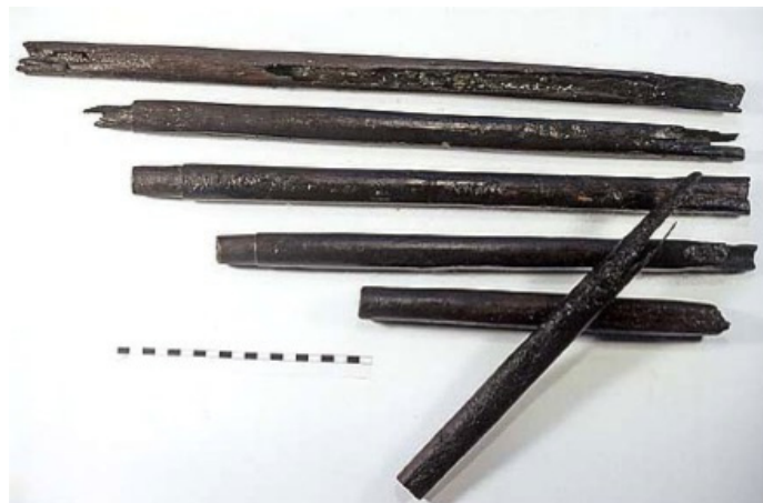
Izq. Algunos de los tubos de Skatovka. Dcha. Los tubos de Wicklow.

(Rusia). Si bien los enterramientos yamna eran bastante pobres en lo que a cultura material se refiere, una de las tumbas de Skatovka sorprendió a los arqueólogos con un rico ajuar que incluía 8 tubos de hueso de ave. Hallazgos semejantes se han producido en los kurgan o túmulos funerarios del yacimiento de Berezhnovka (Rusia) (Sinicyn 1959).