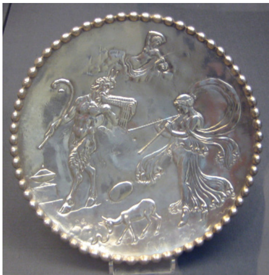
Detalle de uno de los platos pequeños del Tesoro de Mildenhall, conservado en el Museo Británico.

tulae . Seguramente estos instrumentos llegaron a la isla de la mano de las tropas que fueron movilizadas para ocupar guarniciones en sus principales ciudades. Procedentes de Batavia y Frisia (Países Bajos y norte de Alemania), esos soldados (generalmente de origen galo) se asentaron en tierras britanas y muchos de ellos se casaron con mujeres britanas.