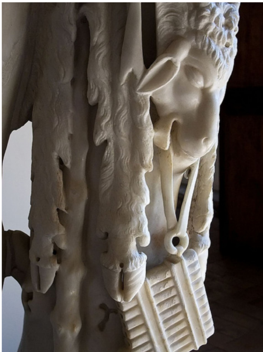
Detalle de Dioniso con pantera y sátiro , conservado en el Museo Nazionale Romano (Italia).

Una de las ilustraciones más conocidas de una flauta de Pan en la cerámica de la Grecia antigua es la que se ve en el Vaso François, una bellísima crátera pintada por Clitias en Ática (Grecia) hacia el 570 a.C. Posee seis frisos decorados con más de doscientas figuras que protagonizan varias escenas míticas. En una de ellas puede observarse, claramente identificada por una etiqueta, a la musa Calíope tocando una syrinx rectangular de 9 tubos (Brown 1981). Antecedente del Vaso François es un vaso dinos del 580 a.C., pintado por Sophilos, en el que están representadas la misma historia y la misma musa sujetando un instrumento similar. Además del anterior, en el Museo Británico se exhibe una hydria ática fechada entre el 540 y el 480 a.C. En su superficie blanca y negra figuran una ménade con una lira acompañada por dos faunos, uno de los cuales lleva consigo una flauta de Pan. Finalmente, otra ilustración famosa es la que aparece en la Crátera de Ceglie, datada hacia el 400 a.C.