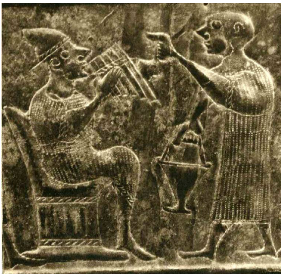
Detalle de los músicos de la Sítula de Vače.