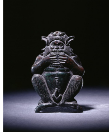
Izq. Urna cineraria del Museo Etrusco Guarnacci de Volterra. Dcha. Pan soplando una flauta .

el norte de la península itálica. Dueños de un lenguaje único y autores de unas magníficas obras de arte, el mundo antiguo les reconoció un gusto refinado y un profundo amor por la música (Martinelli 2007). Como la mayoría de las sociedades mediterráneas contemporáneas, ellos también contaron con flautas de Pan, probablemente heredadas de las culturas de Villanova y de Hallstatt. Su uso se habría visto potenciado merced a los contactos con la Magna Grecia: las colonias griegas asentadas en Sicilia y en las áreas costeras del golfo de Tarento, al sur de Italia.