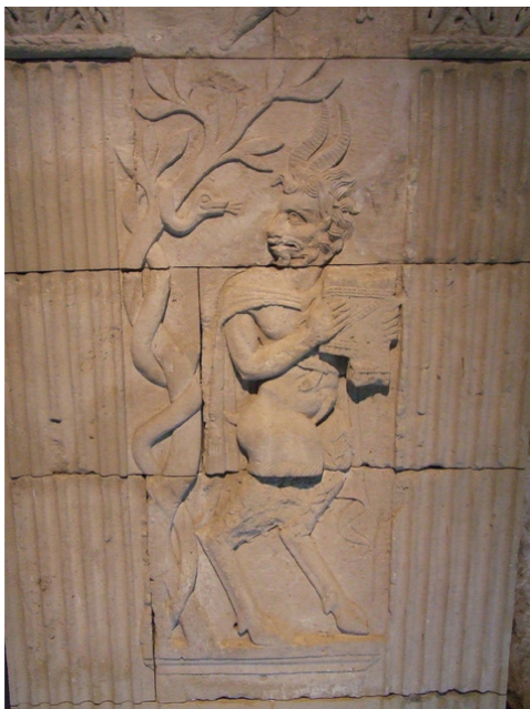
Detalle del monumento funerario de Lucius Poblicius.