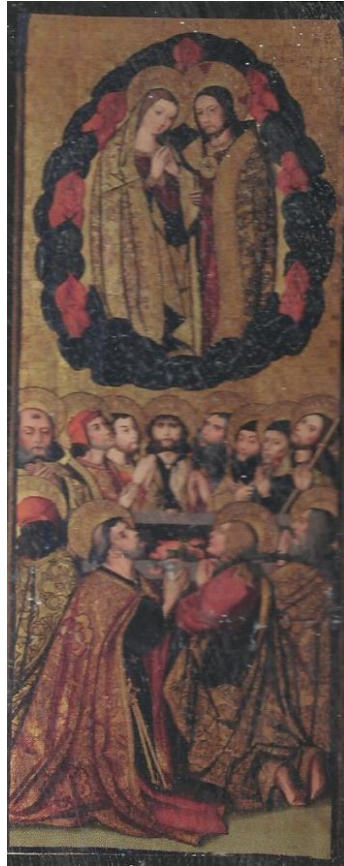
Tabla de la Asunción.

la actualidad dogma de fe desde Pío XII. 71 Es otra de las cuestiones que nos lleva a pensar que la Excelsa Patrona de Baeza y este retablo no eran en su origen una misma pieza.