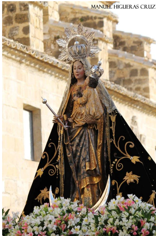
Virgen del Alcázar.

los musulmanes, lo que queda clarísimo es una separación del sínodo del cardenal Moscoso que se promulga en el mismo año y en el fondo vienen los dos a indicar como el día principal la Asunción, independientemente de esa desvinculación que quieren dejar clarísima los dos sínodos de uno frente a otro, sobre todo el de Alcalá La Real.