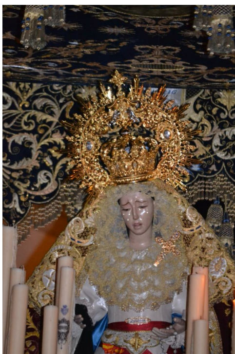
Virgen de los Dolores de la colegiata, actualmente conocida como "La Fervorosa".

Volviendo a la festividad de los Dolores; junto a todo esto y que es otra de las 9 onomásticas marianas, hay que añadir la aparición de la fiesta en el censo de Diego de Zayas Romero.