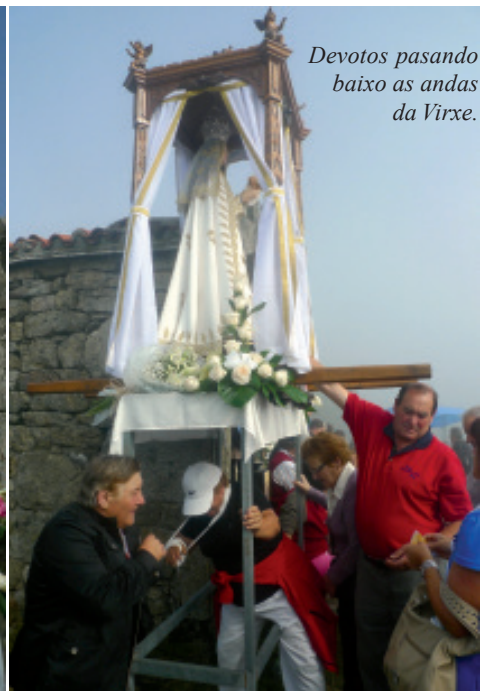
Devotos pasando baixo as andas da Virxe.