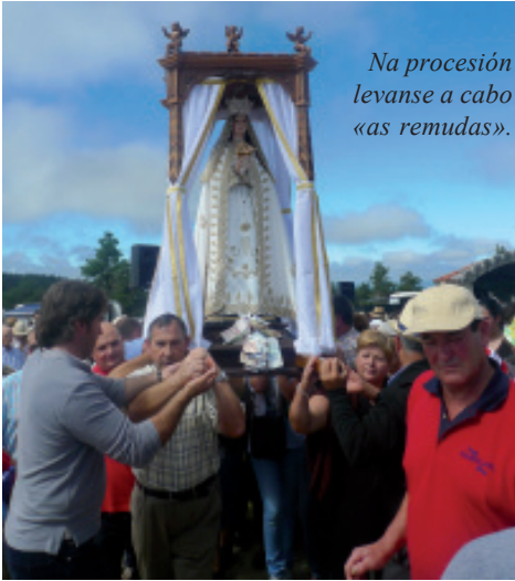
Na procesión levanse a cabo «as remudas».

Quén me dera ir ao Ceo e poder falar cos santos e ver a Nosa Señora amparadora de tantos.