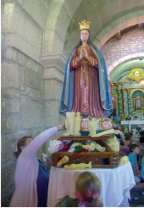
Devota toca cun pano o vestido da Virxe.