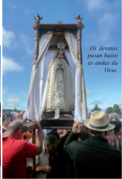
Os devotos pasan baixo as andas da Virxe.

Se sal a Virxe do Faro arredores da capilla florece o toxo e a xesta e hastra a noite faise día.