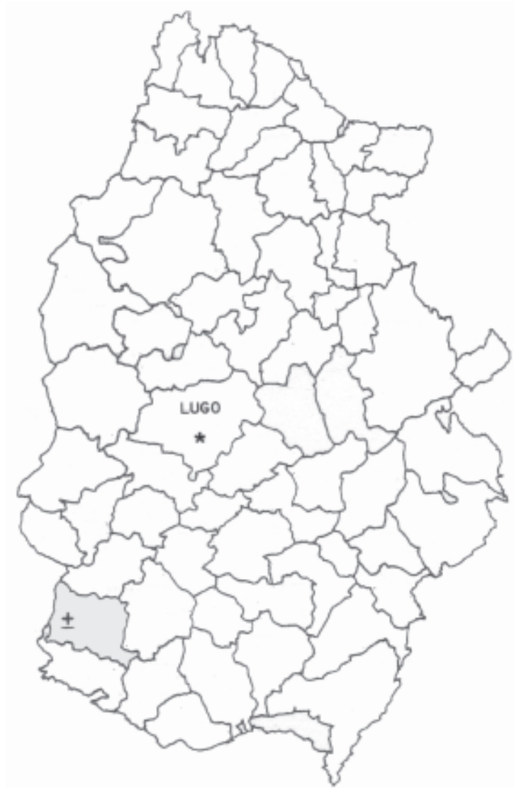
Mapa provincial de Lugo. Concello de Chantada. Santuario de Nosa Señora do Faro (Requeixo - Chantada). Autor: D. José Cancio Fernández