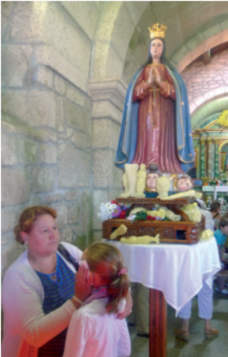
Devota pasa o pano co que tocou a imaxe da Virxe pola cara da súa filla cunha finalidade profiláctica.