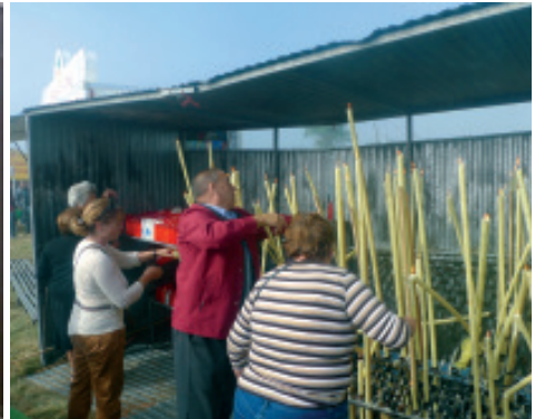
Devotos colocando candeas acesas no interior dun cobertizo de aluminio.