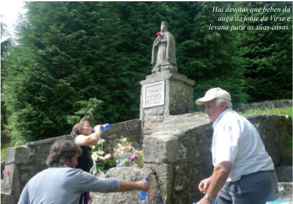
Hai devotos que beben da auga da fonte da Virxe e levana para as súas casas.