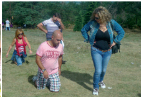
Devotos subindo de xeonllos «a costa da Virxe».