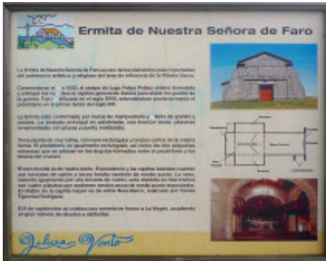
Panel ilustrativo sobre o Santuario.