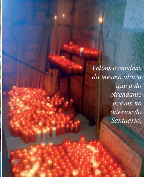
Velóns e candeas da mesma altura que a do ofrendante acesas no interior do Santuario.