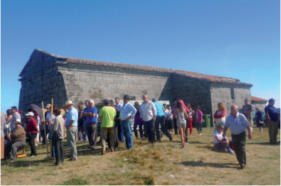
Vista exterior do Santuario da Nosa Sra. do Faro.