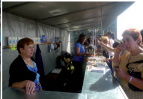
Posto de venda de exvotos de cera e de diferentes obxectos relixiosos. Depende do santuario.