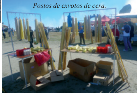
Postos de exvotos de cera.