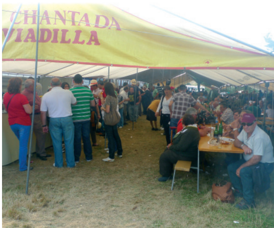
Na romaxe do Faro hai postos de venda de diferentes obxectos e, tamén, pulperías.