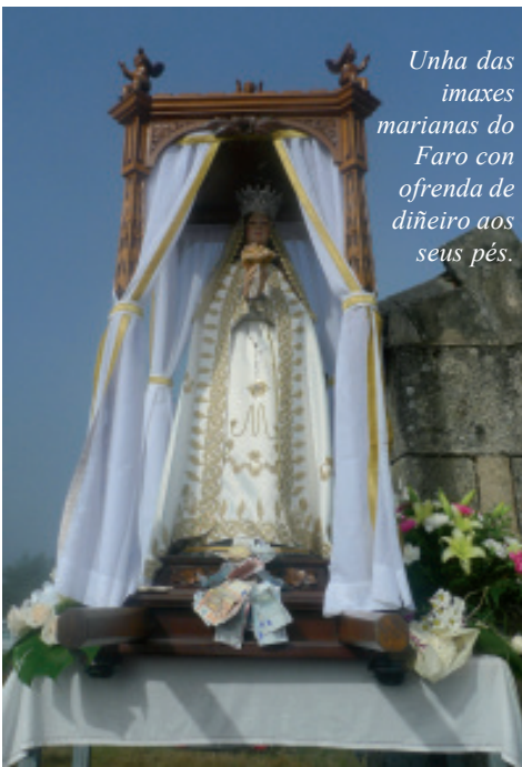
Unha das imaxes marianas do Faro con ofrenda de diñeiro aos seus pés.