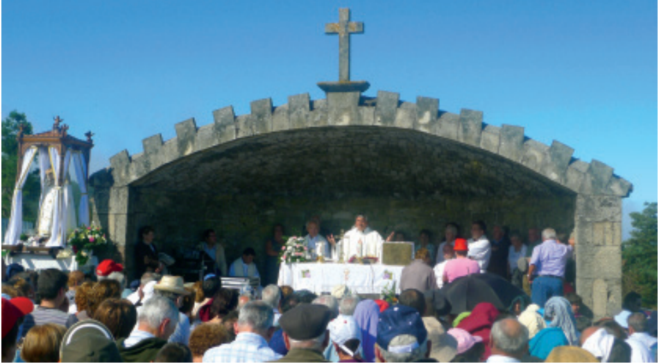
Celebración dunha das misas do Santuario nun cobertizo granítico situado preto da ermida.