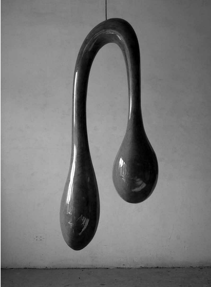
Extensió nº 1. Resina de polièster amb eclisions de filaments de coure. 162 x 68 x 43 cm.