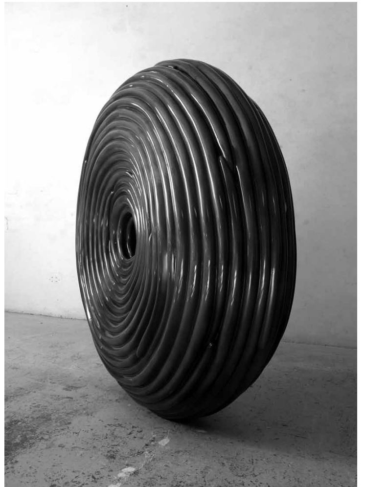
D'esquerra a dreta i de dalt a baix: 1/Tentacles. Acer "pegonado" i resina de polièster amb pintura luminiscent taronja i vernís mat. 215 x 215 x 200 cm 2/Intolerància. Resina de polièster i pintura perlada amb puntes d'acera calibrat. 141 x 136 x 40 cm 3/Carbó nº 5. Carbó de coc i resina de polièster - 100 x 94 x 109 cm 4/A Ple Sol. Resina de polièster amb pintura Brillant-Effect. 156 x 160 x 54 cm.