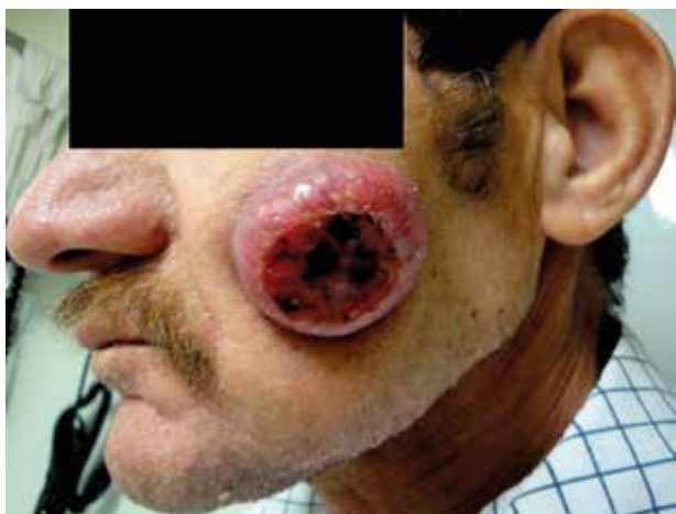
Figura 1. Metástasis cutánea facial

Dicho cuadro se acompañó de pérdida de peso de aproximadamente 6 kg en los últimos cuatro meses, fiebre subjetiva, disnea, dolor torácico, tos seca sin hemoptisis y como antecedente personal de importancia era un fumador pesado. En el examen físico se encontró una lesión tumoral ubicada en la mejilla izquierda de 5 cm de diámetro con 2 cm de profundidad, en el centro se encontraba ulcerada con restos hemáticos, costras en la superficie, secreción serosa escasa y telangiectasias en la periferia (figura 1).