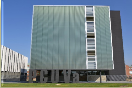
Centro de Transferencia de Tecnologías Aplicadas (CTTA)