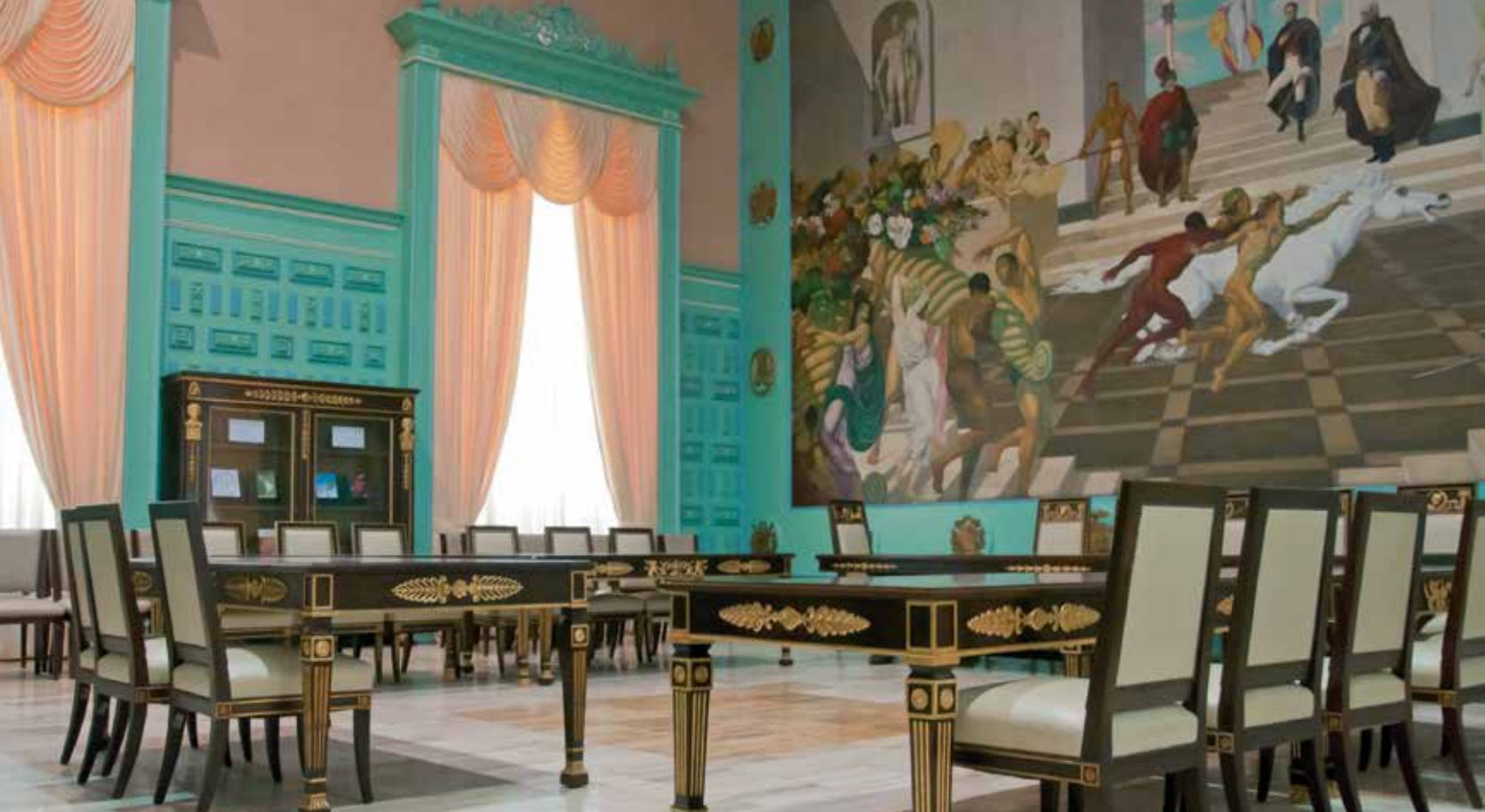
Vista del Salón de los Escudos, 2011

El primer guión museológico desarrolló conceptualmente las características de la exposición permanente Espacios que recorren la República , que delineó un recorrido por los espacios protocolares ubicados en la Planta Baja de la edificación, comenzando por Puerta II: Salón de los Escudos, Salón Miranda, Hemiciclo de Sesiones, Salón Bicentenario, Biblioteca Parlamentaria, Salón del Tríptico, Puerta I y Salón Elíptico. Se tomó en cuenta que cada salón cumple un rol específico como narración visual de la memoria política y en algunos casos también como resguardo de documentos clave en la fundación del estado nacional. Además de describir las principales características patrimoniales de cada uno de estos lugares, este guión incorporó una pauta museográfica que contempló la instalación de varios dispositivos en Puerta II como