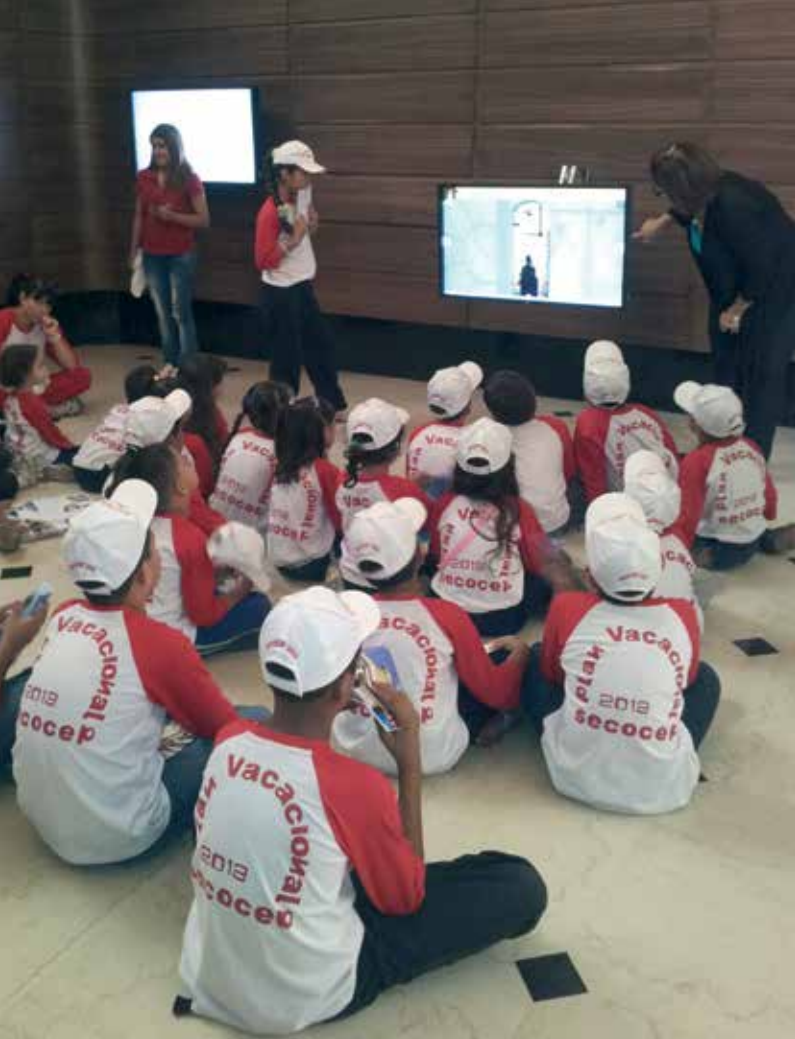
Vista de la visita guiada a un grupo de niños, Plan vacacional de SECOCEP (Secretaría Ejecutiva de la Comisión Central de Planificación), Puerta II, miércoles 31 de julio de 2013

en uso, implica ejecutar múltiples acciones técnicas, administrativas e investigativas, como constantes supervisiones físicas, negociaciones y diseño de estrategias de sensibilización con quienes hacen vida política y administrativa en sus espacios, para mantener las condiciones idóneas que aseguren su conservación física y valor simbólico. La labor museológica se convierte aquí en una práctica cotidiana, pues algunos elementos patrimoniales pueden llegar a ser apreciados solo como objetos de uso. Esta cosificación afecta la seguridad física y simbólica del patrimonio, lo cual es notable en la manipulación del mobiliario. El cuidado patri-