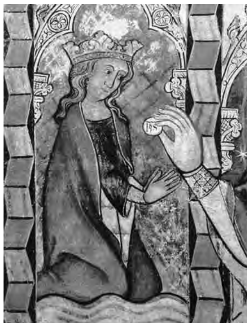
Representació de la reina Sibil·la en les pintures murals procedents de Sant Miquel de Daroca. Museu de Zaragoza.

Finalment, es va concertar el matrimoni d'Isabel amb Jaume, fill i hereu del comte Pere d'Urgell. En un projecte anterior el comte d'Urgell havia fet tracte de casar el seu fill Jaume amb la néta de la comtessa de Prades, Joana. Així, el rei Martí el dia 5 de juny de l'any 1400 els comunicava a ambdós que estava d'acord amb aquest matrimoni. 13 De tota manera, aquests tractes no van arribar a conclusió i Joana de