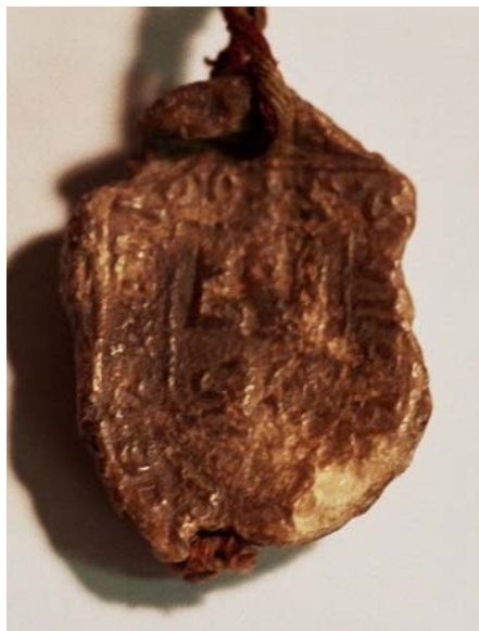
Figura 5: Sello concejil de Cellorigo depositado en el AMN (1282).

El castillo tendría la doble función de recordar la jurisdicción del rey de Castilla, al insertar su símbolo en el escudo, y representar la fortaleza de la localidad, hoy casi desaparecida. No se puede olvidar que Cellorigo se vio envuelta durante siglos en disputas y batallas entre los reyes de Castilla, Navarra y musulmanes. Más complicado resulta desentrañar el significado del león, ya que no corresponde a la representación alegórica del patrón de la localidad o del nombre de la localidad, de etimología discutible.