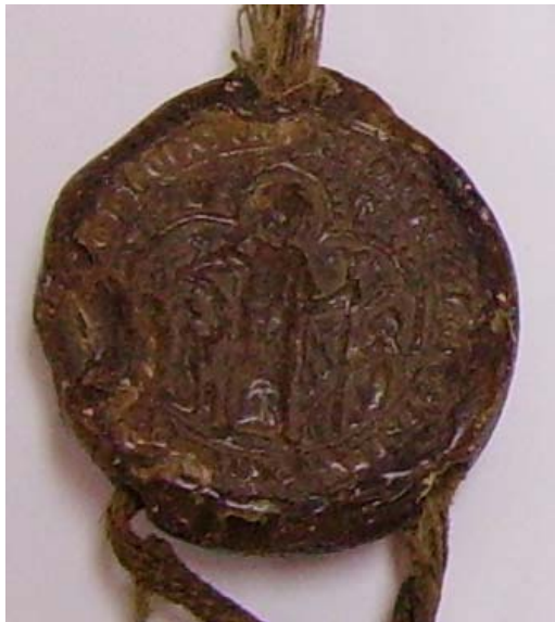
Figura 12: Sello del Concejo de Santo Domingo del año 1358. AMSDC.

De 1358 es el sello conservado en el AMSDC pendiente de la carta de hermandad entre los concejos de la ciudad calceatense y la vecina villa de Bañares 140 y de 1360 el sello de una avenencia entre el concejo y la iglesia de la Calzada 141 (figura 12).