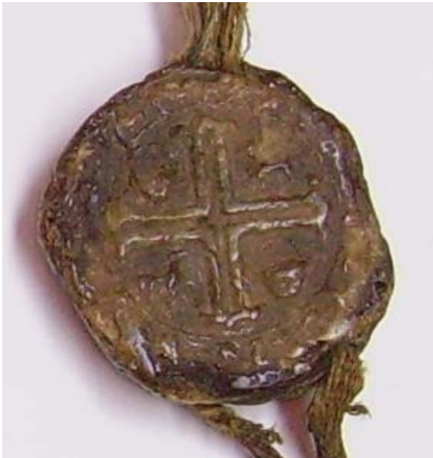
Figura 3: Sello medieval de Bañares conservado en el Archivo Municipal de Santo Domingo de la Calzada (1358).

No podemos considerar éste como un escudo, ya que no se incluye dentro del campo heráldico, aunque todos los elementos que aparecen son emblemas paraheráldicos. De 1358 es el sello conservado, pendiendo de la carta de hermandad entre los concejos de la villa de Bañares y la vecina ciudad calceatense. Así, la fecha aportada por Palacios no se atiene a la datación del propio archivo.