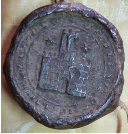
Figura 1: Sello del concejo de Albelda de Iregua, 1315. Fotografía en ESQUIDE EIZAGA, D.: Sigilografía medieval: Logroño .

Hemos de considerar estos símbolos, el castillo donjonado y las estrellas, como señales para-heráldicas, ya que no están inscritos dentro del campo de un escudo. Ambos están rodeados por la leyenda + : SIGILLVM : CONCILII ALBAIDENSIS , es decir, “Sello del Concejo de Albelda”. Estos serán los elementos que volverán a conformar el escudo de Albelda ya a finales del siglo XX.