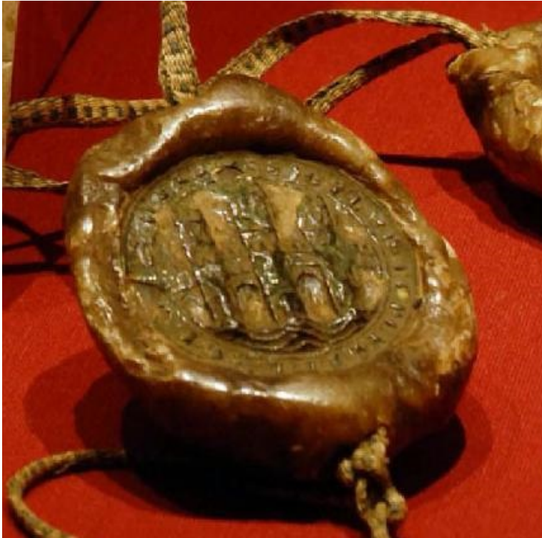
Figura 8: Sello de Logroño de 1312.

El sello del AMN de 1296, al no ser de doble impronta, hemos de suponer que correspondería a la tipología del sello concejil de 1312, ya que el deterioro del sello o la falta de la parte inferior del mismo (posiblemente con ondas) puede confundir fácilmente el aspecto del puente con el de un castillo o fortaleza, al ser defendido el viaducto.