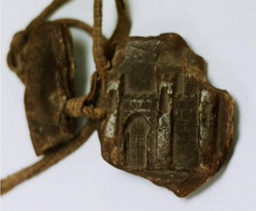
Figura 7: Sello del concejo de Logroño de 1285. En el anverso se ve el puente defendido y en el reverso una fortaleza.

concejiles castellano-leoneses medievales antiguos, de tipo bifaz, era habitual que en el reverso figurase la figura heráldica que identificaba al reino al que pertenecía la ciudad 79 : un castillo en Castilla y un león para León, al contrario que en Navarra, donde los emblemas heráldicos reales rara vez aparecen acaso como elemento secundario 80 . En el caso del sello logroñés aparece una fortaleza amurallada que ocupa casi todo el campo de la impronta.