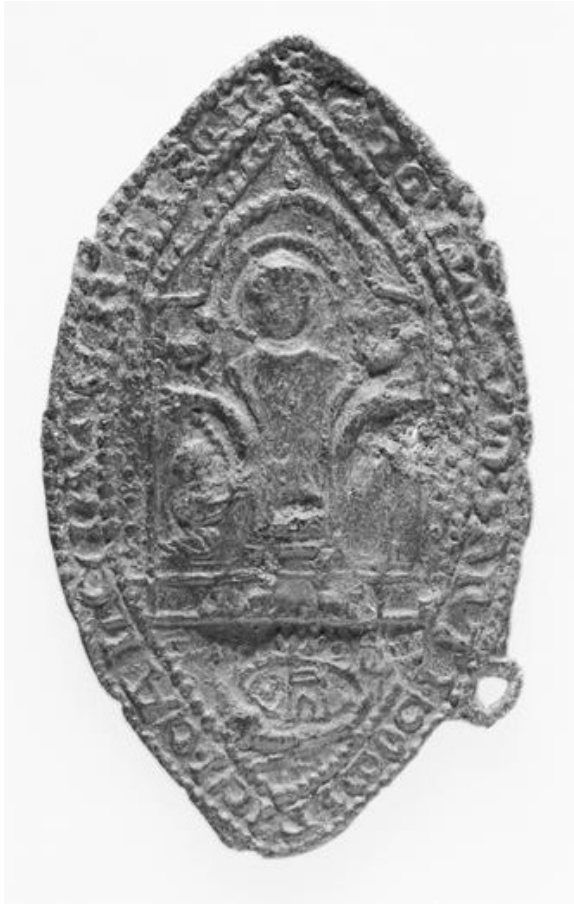
Figura 13: Sello de peregrino de Santo Domingo de la Calzada. Siglos XIII-XIV. Imagen del sello disponible en http://www.photo.rmn.fr/LowRes2/TR1/2TS4GY/97-011842.jpg

Localisation: Paris, musée de Cluny - musée national du Moyen-Age