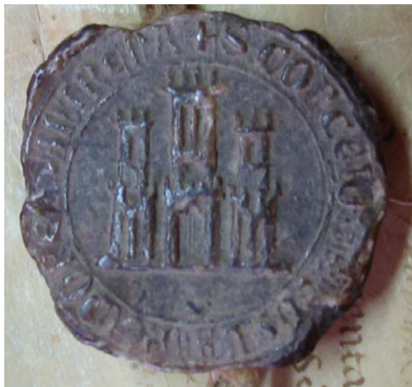
Figura 6: Sello concejil de Entrena depositado en el ACL (1278).