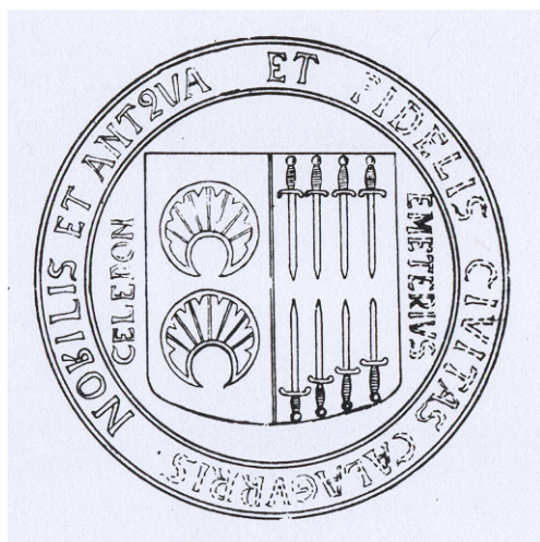
Figura 4: Sello del municipio de Calahorra del siglo XVI. Imagen en GUTIÉRREZ ACHÚTEGUI, P.: Historia de la muy noble, antigua y leal ciudad de Calahorra , p. 378.

...es redondo por la parte inferior, como son los escudos españoles, partido, llevando a su derecha dos aureolas, y a su izquierda, cuatro espadas, punta arriba y otras cuatro punta abajo. Fuera del escudo, y dentro del círculo en el que va, a la derecha tiene la palabra CELEDÓN, y a la izquierda EMETERIUS. Circunda entre el doble círculo la leyenda NOBILIS ET ANTIQVA ET FIDELIS CIVITAS CALAGURRIS.