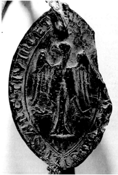
Figura 11: Sello de San Vicente de la Sonsierra (1305).