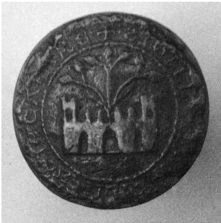
Figura 10: Copia del sello del concejo de Sajazarra depositado en el AHN (1295).

Casi todos los concejos castellanos llevaban en el anverso o reverso la imagen del castillo, símbolo de la pertenencia o sumisión al reino de Castilla, siendo además, como en el caso de Sajazarra, el reflejo icónico de la fortaleza y murallas que guardaban la localidad y que fue sustituida por el castillo actual del siglo XV. Más difícil es descifrar el significado del árbol o vegetación que emerge del castillo. El castillo tiene la particularidad de tener solamente tres torrecillas, frente a las tres del modelo heráldico castellano tradicional. Así, podemos considerarlo una fortaleza o recinto amurallado del que emerge el extraño brote vegetal. No hemos conseguido relacionarlo con una antigua etimología del nombre de Sajazarra, así que, probablemente, sea la representación de un árbol característico o monumental que tenía la localidad dentro del recinto amurallado y que resultaba lo más distintivo en el momento de representarla, en pleno siglo XIII.