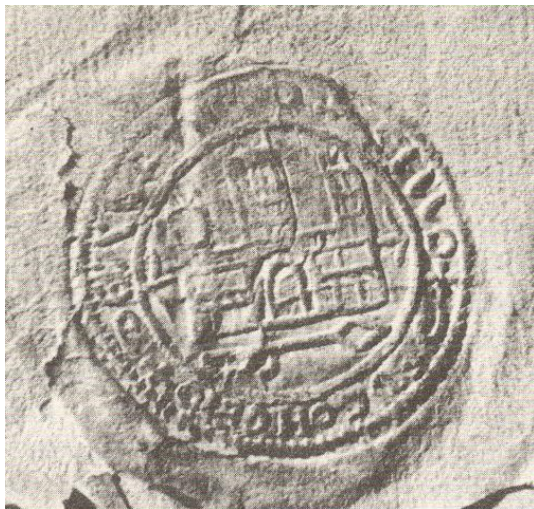
Figura 2: Primer sello documentado con las armas de la ciudad de Alfaro. Siglo XIV. Imagen en MARTÍNEZ DÍEZ, J.: Historia de Alfaro , p. 91.

Este escudo pertenece al grupo de emblemas de la primera heráldica, en los que con bastante frecuencia no se incluían dentro del campo del escudo, ya que lo importante era el símbolo, independientemente de la aplicación en la que se estampara, ya fuera, como en este caso, un sello o un escudo militar o los adornos de una vestimenta.