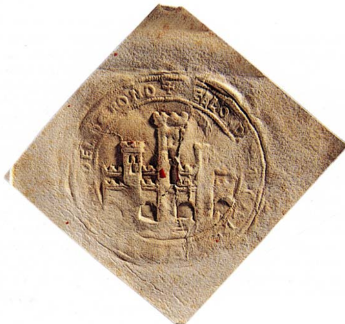
Figura 9: Sello de Logroño de 1507.

El sello del concejo logroñés lleva en el campo un puente almenado de cuatro ojos, sobre ondas, defendido por tres torres que son la prolongación de los pilares visibles del puente (figura 9). Al puente se le ve una doble fila de almenas, creando sensación de profundidad en la vía de paso o tablero. Las torres laterales son también almenadas con tres aspilleras ordenadas dos arriba y una abajo. La torre central es más alta que las otras, también almenada y con dos y una troneras defensivas. En orla, la leyenda ilegible en gran parte, +SELLO D[EL CONCEJO] DE LOGROÑO.