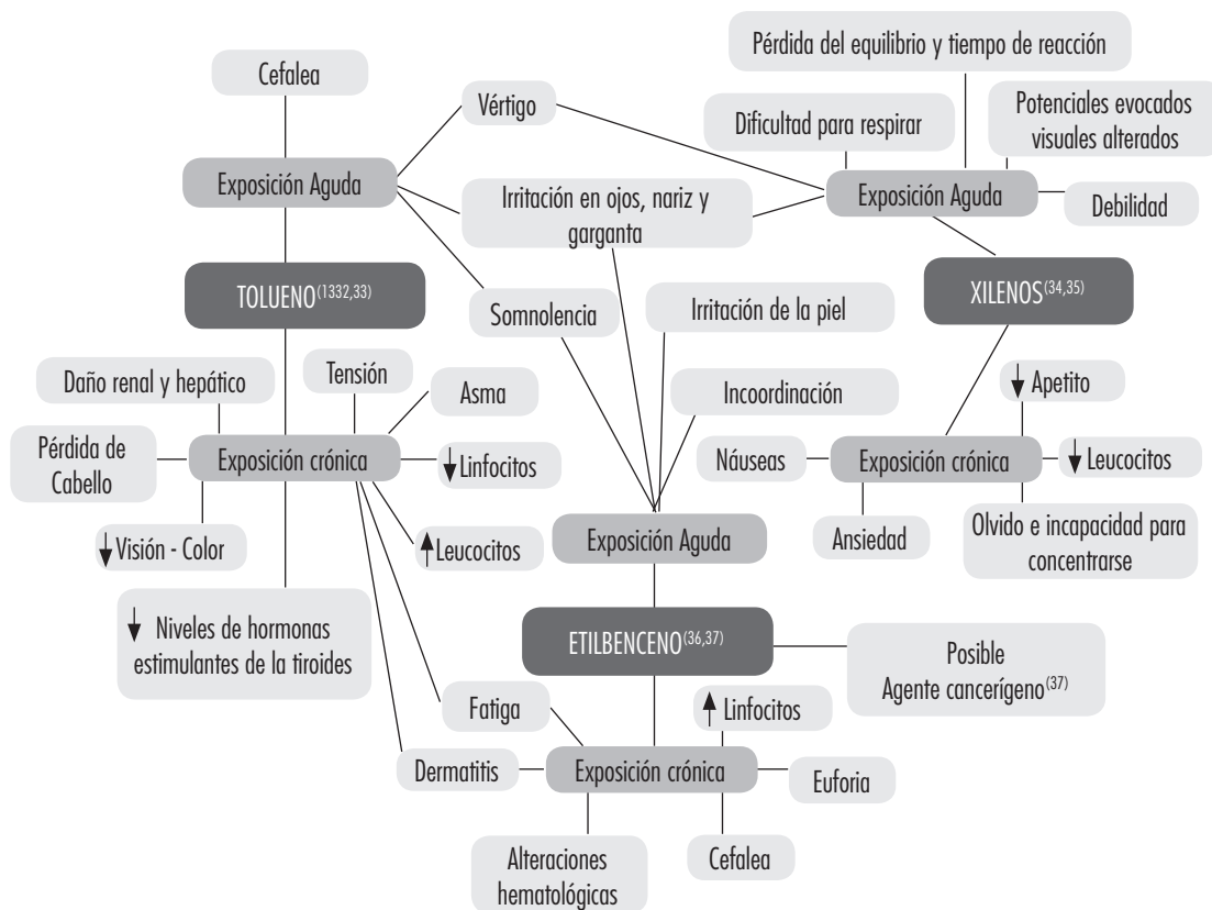
Figura 3. Efectos en la salud asociados con la exposición aguda y crónica a los principales componentes del thinner. ↑ Aumenta, ↓ Disminuye. Las citas bibliográficas aparecen como superíndices.

que están expuestos, de tal forma que lo manipulan de forma inadecuada y, frecuentemente, sin ningún tipo de protección (38, 39). En el año 2003, un estudio realizado en dos fábricas de pinturas de la ciudad de Bogotá, mostró que el 37,7 % de sus trabajadores estaban expuestos a thinner; sin embargo, con respecto a personas no expuestas no se encontraron diferencias estadísticas para los biomarcadores genéticos examinados (39). De igual forma, en un estudio de aberraciones cromosómicas realizado en 200 trabajadores (pintores de carros) que estuvieron expuestos a thinner comercial, fue encontrado un aumento estadísticamente significativo en la frecuencia de aberraciones