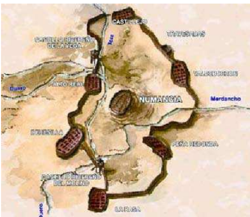
Numancia y el cerco romano de Escipión (134-133 a. C.).

No obstante, éramos conscientes de que había que dar un salto cualitativo en Numancia para que el yacimiento fuera mejor entendido. A tal fin se reconstruyeron sobre su base original una casa de la ciudad celtibérica y otra de la romana, que muestra-