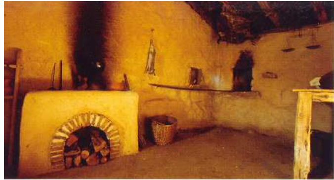
Arriba izq.: Detalle del corral con el cobertizo para los animales, adosado a la casa celtibérica. Abajo izq.: Detalle interior con el hogar. Arriba dcha.: Parte de la casa romana con su entorno. Abajo dcha.: Ambiente interior de la casa romana con el hogar y la boca del horno de pan que queda al exterior.

ran sus diferentes ámbitos domésticos y permitieran establecer semejanzas y diferencias, a través de las referencias de altura, volumen y compartimentación, propiciando de esta manera la dimensión espacial. El acondicionamiento interior de las diferentes estancias se hizo a partir de la información arqueológica, complementada con referentes etnográficos, técnicas tradicionales y la arqueología experimental, que sirvieran de puente entre pasado y presente, para conseguir que la visita no sólo fuera viva, sino también vivida.