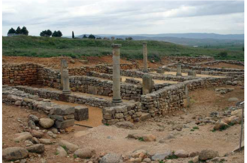
Izq.: Monumentos a los héroes numantinos (de 1842 y 1905). Dcha.: Casas con patios porticados en el barrio sur, lo más visible durante mucho tiempo en Numancia.