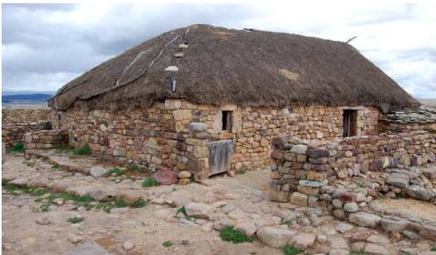
Arriba: Casas celtibéricas que comparten medianería. Abajo: Casa romana.