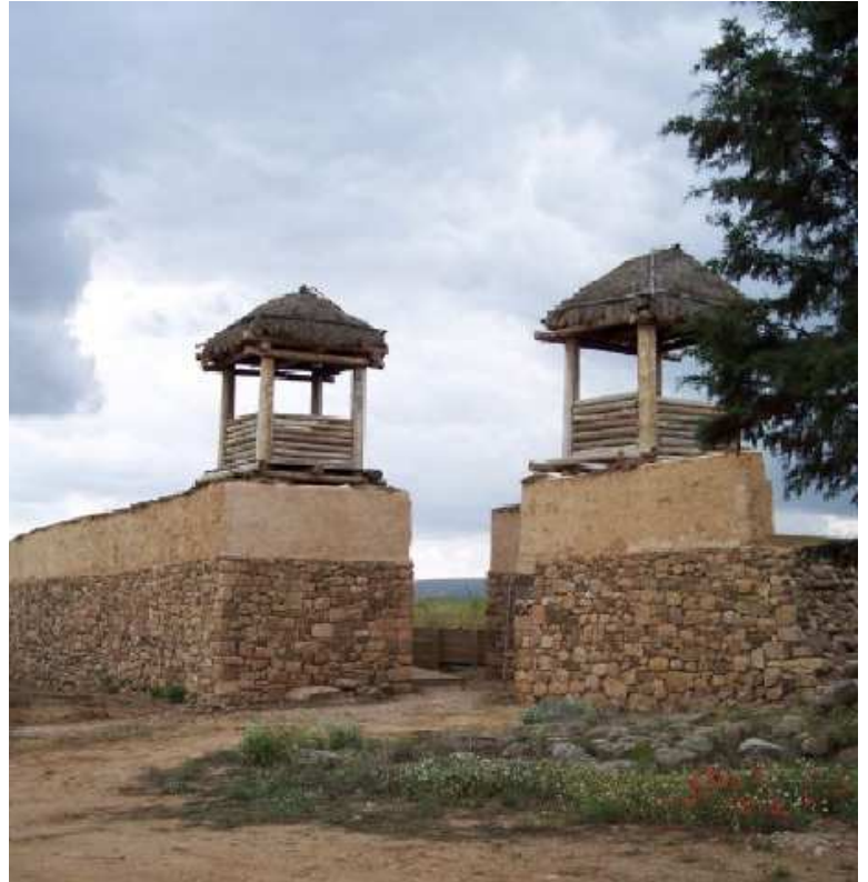
Arriba izq.: Detalle de una de las calles con aceras y piedras pasaderas. Abajo izq.: Uno de los aljibes de la ciudad para el abastecimiento de agua. Izq.: Tramo de muralla reconstruido con dos torres para la defensa de la puerta de entrada.

de Numancia, integrado en el conjunto de posibilidades de atracción y desarrollo de una zona (paisajísticas, ambientales o de otro tipo) se ha convertido en elemento de desarrollo, ganando en valoración y aprecio social, como lo demuestra el número de visitantes.