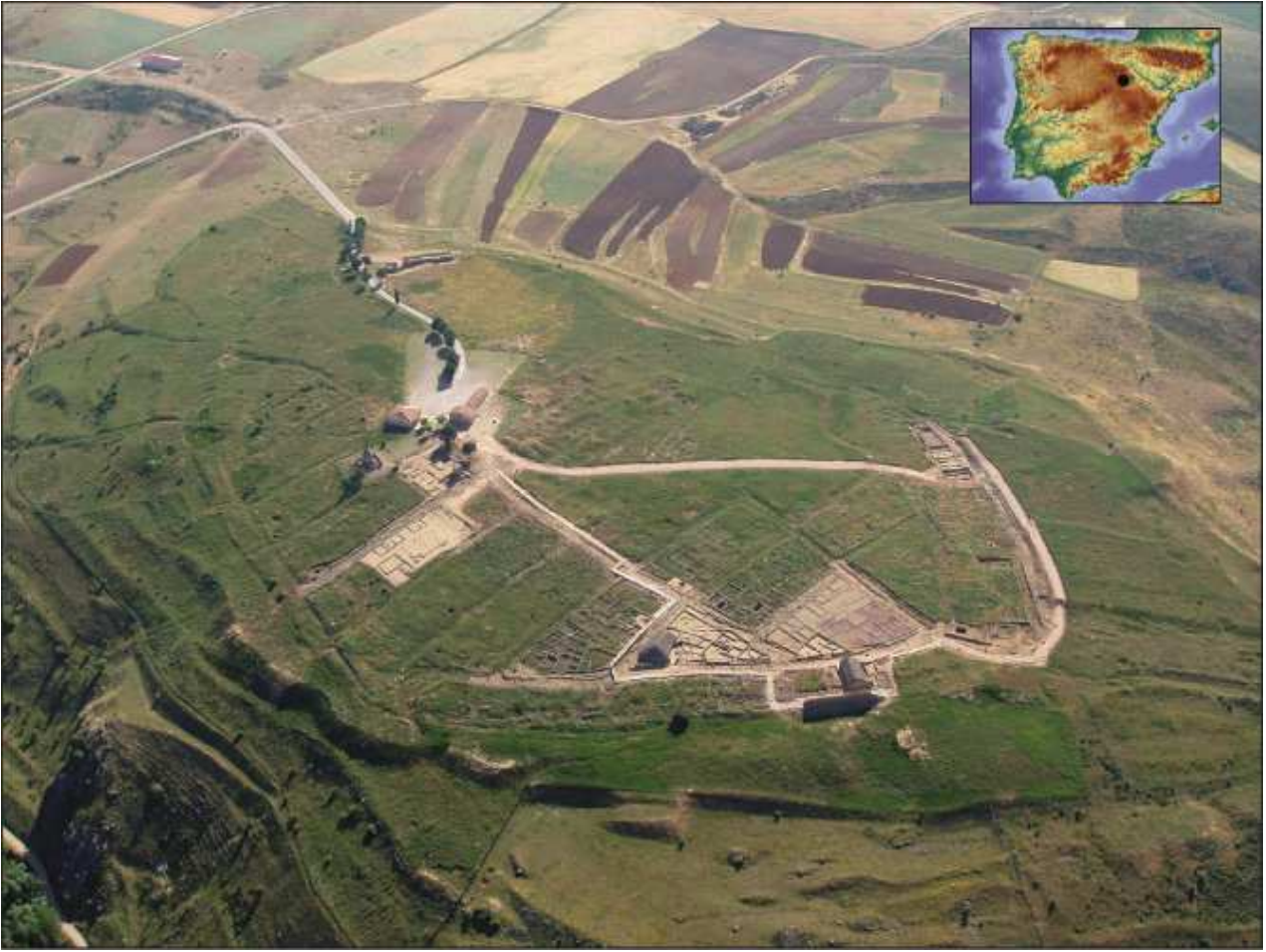
Vista aérea de Numancia.