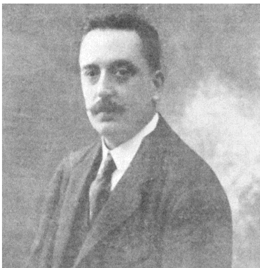
Federico Reparaz Chamorro. Posando para la Portada de la revista La Novela Cómica , donde se presenta su obra "Lluvia de hijos" 1916

Aunque natural de Linares, lo cierto es que la mayor parte de su vida transcurrió fuera de nuestra ciudad. Hizo los primeros estudios en Badajoz y en 1895 ingresó en el Cuerpo de Telégrafos con el primer número de su promoción. Dos años después fue nombrado oficial en la Secretaría del Senado, cargo que desempeñó a lo largo de quince años hasta las vísperas de su muerte. Asimismo fue director de la biblioteca de la Dirección General de Telégrafos y colaboró en numerosos periódicos y revistas.