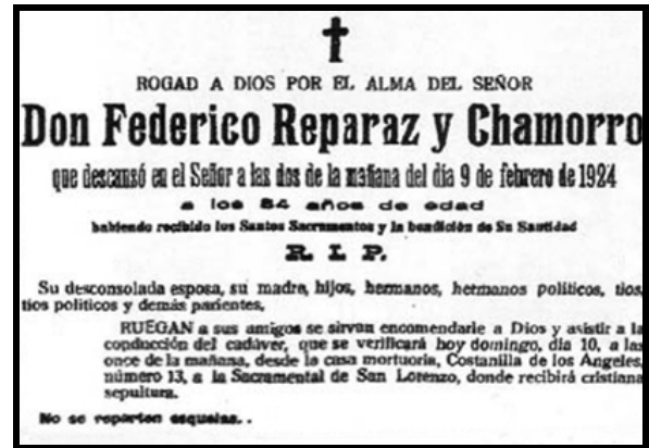
Esquela en El Imparcial (Madrid), 10 febrero 1924

Ya en la década de los veinte podemos citar: El canto del cisne , (comedia en tres actos, 1920), El paraíso cerrado , (comedia farsa en tres actos, San Sebastián y Madrid, 1922), El director es un «hacha» , (historieta cómica en tres actos, 1923), La Pimpinela Escarlata (1924), Teodoro y Compañía , (vodevil en tres actos, 1923), Mi cocinera (1927), El eterno don Juan (1928) y Wu-Li-Chang (1928), entre otras.