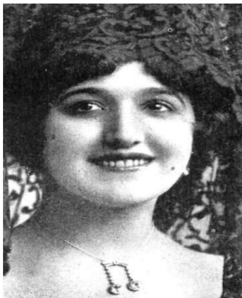
Salud Ruíz. Famosa estrella de "varietés". 10 de noviembre de 1920.

Nacida en Linares en diciembre de 1895, 1 no se conocen los motivos ni las